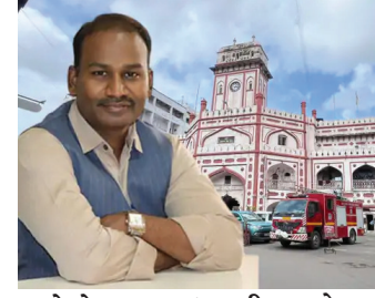
આદેશો આપવામાં આવી રહ્યા છે. સુરત બ્રિજ સિટી તરીકે ઓળખાય છે, અને આ બ્રિજો શહેરની સુંદરતામાં વધારો કરે તે માટે પાલિકાએ વિશેષ આયોજન કર્યું છે. હાલમાં શહેરના બ્રિજો પર રંગ-રોગાનની કામગીરી ચાલી રહી છે. બ્રિજોની નીચેના ભાગમાં થતું દબાણ દૂર કરી ત્યાં પેવર બ્લોક નાખવા અથવા આકર્ષક પેઈન્ટિંગ્સ બનાવવાનું કામ પૂરજોશમાં છે.

• સુરત સ્વચ્છતાના આ મહાકુંભમાં કોઈ પણ પ્રકારની કચાશ ન રહી જાય તે માટે પુદ્ મ્યુનિસિપલ કમિશનર એમ. નાગરાજને મેદાનમાં ઉતર્યા છે. છેલ્લા કેટલાક દિવસોથી કમિશનર દ્વારા શહેરના વિવિધ ઝોન જેમ કે વરાછા, કતારગામ, અઠવા અને રાઈદરમાં વહેલી સવારથી જ સરપ્રાઈઝ ચેકિંગ હાથ ધરવામાં આવી રહ્યું છે. કમિશનરની આ મુલાકાતો માત્ર મુખ્ય માર્ગો પૂરતી મર્યાદિત નથી, પરંતુ તેઓ આંતરિક ગલીઓ, જાહેર શોચાલયો, કચરાના ડેપો અને ટ્રાન્સફર સ્ટેશનોની પણ ઝીણવટભરી તપાસ કરી રહ્યા છે. જે વિસ્તારોમાં સફાઈમાં બેદરકારી જોવા મળે છે ત્યાં સ્થળ પર જ અધિકારીઓને ખખડાવીને તાત્કાલિક કામગીરી સુધારવા આદેશો આપવામાં આવી રહ્યા છે. સુરત બ્રિજ સિટી તરીકે ઓળખાય છે, અને આ બ્રિજો શહેરની સુંદરતામાં વધારો કરે તે માટે પાલિકાએ વિશેષ આયોજન કર્યું છે. હાલમાં શહેરના બ્રિજો પર રંગ-રોગાનની કામગીરી ચાલી રહી છે. બ્રિજોની નીચેના ભાગમાં થતું દબાણ દૂર કરી ત્યાં પેવર બ્લોક નાખવા અથવા આકર્ષક પેઈન્ટિંગ્સ બનાવવાનું કામ પૂરજોશમાં છે.