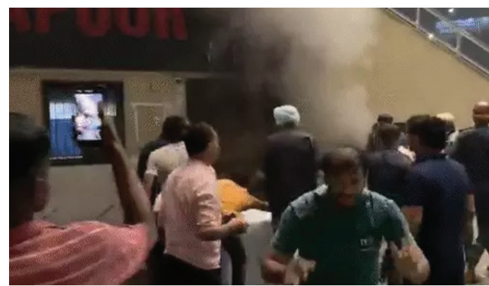
ધારણ કરી લીધું હતું. આગ લાગતા જ આસપાસના લોકો અને વેપારીઓએ એકઠા થઈને લહેંગા અને શૂટના કિંમતી

સુરત શહેરના ધમધમતા રીંગરોડ વિસ્તારમાં આવેલી જાણીતી મિલેનિયમ-1 ટેક્સટાઇલ માર્કેટમાં આજે અચાનક આગ ફાટી નીકળતા અફરાતફરીનો માહોલ સર્જાયો હતો. ગ્રાઉન્ડ ફ્લોર પર આવેલી કાપડની દુકાનમાં લાગેલી આગને પગલે ધુમાડાના ગોદેગોટા ઉઠતા વેપારીઓ અને ગ્રાહકોમાં નાસભાગ મચી ગઈ હતી. જોકે, હાલ આગ કાબૂમાં આવી ગઈ છે. માર્કેટના ગ્રાઉન્ડ ફ્લોર પર આવેલી 'કપૂર લહેંગા, શૂટ અને સાડી' નામની દુકાનમાં શોર્ટ સર્કિટ અથવા અન્ય અકસ્માતને કારણે અચાનક આગ લાગી હતી. દુકાનમાં કાપડનો જથ્થો હોવાથી જોતજોતામાં આગે વિકરણ સ્વરૂપે