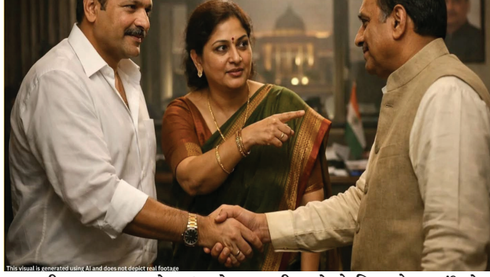
મધ્યસ્થીના સમગ્ર ખેલમાં એક પૂર્વ મહિલા કોર્પોરેટરની ભૂમિકા સૌથી મહત્વની હોવાનું સામે આવ્યું છે. ટિકિટના દાવેદાર બિલ્ડર અને ગાંધીનગરના મંત્રી વચ્ચે સેતુ બનાવવાનું કામ આ પૂર્વ કોર્પોરેટર કરી રહ્યા છે. ગાંધીનગર સુધી દોડ લગાવીને બિલ્ડરના નામની ભલામણ કરવા માટે એડીટોરિયું જોર લગાવવામાં આવી રહ્યું છે, જેના કારણે વર્ષોથી પક્ષ માટે લોહી-પરસેવો એક કરનારા પાયાના કાર્યકરોમાં છૂપો રોષ જોવા

વડોદરા મ્યુનિસિપલ કોર્પોરેશનની ચૂંટણીના પડઘમ વાગતાની સાથે જ રાજકીય ગલિયારાઓમાં ટિકિટ મેળવવા માટેની ખેંચતાણ ચરમસીમાએ પહોંચી છે. પક્ષ પ્રત્યેની વફાદારી કરતાં હવે 'પ્રભાવ' અને 'પૈસા'નું જોર વધુ ચર્ચાઈ રહ્યું છે. તાજેતરમાં એક બિલ્ડર દ્વારા ચૂંટણીનો તમામ ખર્ચ ઉઠાવવાની ઓફર સાથે મંત્રી સુધી પહોંચવાના પ્રયાસોએ શહેરના રાજકારણમાં ભારે ચર્ચા જગાવી છે. રાજકીય સૂત્રોના જણાવ્યા અનુસાર, વડોદરાના એક જાણીતા બિલ્ડરે આગામી ચૂંટણીમાં ટિકિટ મેળવવા માટે મસમોટું આયોજન કર્યું છે. ચર્ચા છે કે આ બિલ્ડરે પક્ષના મોવડી મડળ સમક્ષ ચૂંટણીનો સંપૂર્ણ આર્થિક ભાર ઉઠાવવાની તૈયારી દર્શાવી છે. સત્તાધારી પક્ષના એક વઘદાર મંત્રી સુધી પોતાની વાત પહોંચાડવા માટે બિલ્ડરે સામ, દામ, દંડ અને ભેદની નીતિ અપનાવી હોવાનું મનાય છે. પૂર્વ મહિલા કોર્પોરેટરની