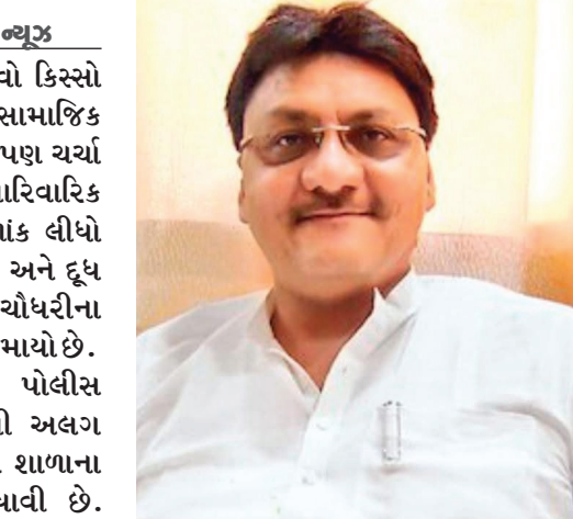
બાદ પોલીસે ગુનો નોંધી તપાસના ચક્રો ગતિમાન કર્યા છે. વિપુલ ચૌધરી સાથેના સંબંધોના આક્ષેપથી બળભળાટ

વડોદરા શહેરમાંથી એક એવો કિસ્સો પ્રકાશમાં આવ્યો છે જેણે માત્ર સામાજિક જ નહીં પણ રાજકીય વર્તુળોમાં પણ ચર્ચા જગાવી છે. એક પતિ-પત્નીના પારિવારિક વિવાદે હવે ગંભીર કાનૂની વળાંક લીધો છે, જેમાં રાજ્યના પૂર્વ ગૃહમંત્રી અને દૂધ સાગર ડેરીના પૂર્વ ચેરમેન વિપુલ ચૌધરીના નામનો ઉલ્લેખ થતા મામલો ગરમાયો છે. વડોદરાના અટલાદરા પોલીસ સ્ટેશનમાં એક પતિએ પોતાની અલગ રહેતી પત્ની અને એક ખાનગી શાળાના સંચાલક વિરુદ્ધ ફરિયાદ નોંધાવી છે. ફરિયાદનો મુખ્ય મુદ્દો એ છે કે, પિતાની કોઈપણ પ્રકારની મંજૂરી લીધા વગર પત્નીએ બંને દીકરીઓની સરનેમ બદલી નાખી છે. આ મામલે કોર્ટે દબલગીરી કરવી પડી હતી અને કોર્ટના આદેશ