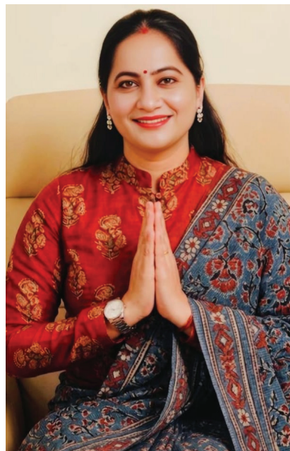
હાર સ્વીકારી લેવી એ જ ખરી હાર છે, બાકી મેદાનમાં પછડાયા પછી ઊભા થવું એ જ વીરતા છે.

ગીતાનો બીજો અધ્યાય એ માત્ર જ્ઞાનનો સંગ્રહ નથી, પણ માનસિક સ્વાસ્થ્ય (Mental Health) નો સૌથી મોટો ગ્રંથ છે. પ્રથમ અધ્યાયના અંતે અર્જુન જે સ્થિતિમાં હતો, તેને આજની ભાષામાં આપણે 'ગંભીર ડિપ્રેશન' કે 'પેનિક એટેક' કહી શકીએ. હાથ ધ્રુજવા, પરસેવો છૂટવો અને લડવાનો વિચાર સુધ્ધાં છોડી દેવો આ એક એવા માણસના લક્ષણો હતા જે પોતાની લડાઈ લડતા પહેલા જ હારી ગયો હતો.