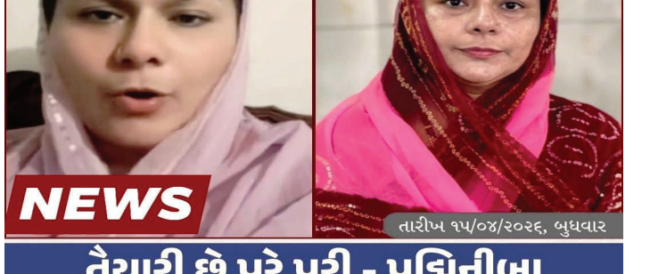
તૈયારી છે પુરે પુરી - પંચિનીબા

અમદાવાદ/રાજકોટ: ગુજરાતના રાજકારણમાં ફરી એકવાર ગરમાવો આવ્યો છે. આમ આદમી પાર્ટી (AAP) ના કાયરબ્રાન્ડ નેતા પંચિનીબા વાળાએ સત્તાધારી પક્ષ ભાજપ સામે બાંધ્યો ચઢાવી છે. એક વીડિયો સંદેશ જાહેર કરીને તેમણે જે અંદાજમાં ડુંકાર કર્યો છે, તેનાથી રાજકીય ગલીયારાઓમાં ખળભળાટ મચી ગયો છે. શું છે પુરું વિવાદ? પંચિનીબા વાળાએ ગંભીર આરોપ લગાવ્યો છે કે છેલ્લા 4-5 દિવસથી તેમના પક્ષના ઉમેદવારોને સતત ધમકાવવામાં આવી રહ્યા છે. આરોપ મુજબ, અજાણ્યા નંબર પરથી ફોન કરીને ઉમેદવારો પર ફોર્મ પરત ખેંચવા માટે દબાણ કરવામાં આવી રહ્યું છે. લોકશાહીના પર્વમાં આ પ્રકારે ડરાવી-ધમકાવીને ચૂંટણી જીતવાના પ્રયાસો સામે પંચિનીબાએ લાલ આંખ કરી છે. 'આ છેલ્લી વોર્નિંગ છે...' વીડિયો મારફતે ભાજપના નેતાઓ અને કાર્યકર્તાઓને લલકારતા પંચિનીબાએ કહ્યું: 'જો ઉમેદવારોને ધમકાવવાનું બંધ