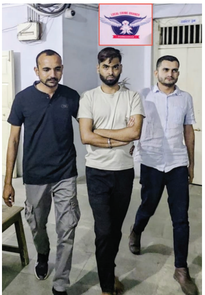
લઈ કેટીટકાર્ટ ઓનલાઈન રકમ ટ્રાન્સફર કરી ફરીયાદી તથા સાહેબોના અલગ અલગ રકમ મળી કુલ રૂ. ૩,૫૦,૦૦૦/ ઓનલાઈન ટ્રાન્સફર કરી ફરિયાદી તથા સાહેબો સાથે છેતરપીંડી કરી ગુનો કરેલ હોવાનો ગુનો રજી. થયેલ.

• ગોસા(વેડ)તા.૦૫ પોરબંદરમાં વર્ષ ૨૦૨૨ ની સાલમાં કંચાર હોટલમાં મીટીંગ કરીને ટુર પેકેજના નામે મોટી છેતરપિંડી કરવાના કમલાબાગ પોલીસ સ્ટેશનના ગુનામાં ૪ વર્ષથી વોન્ટેડ ઈસમને અમદાવાદ ખાતે પોરબંદર એલ.સી.બી.ને ઝડપી પાડવામાં સફળતા મળી છે. કમલાબાગ પોલીસ સ્ટેશનમાં ગત તા.૧૨/૦૮/૨૦૨૨ ના રોજ રજી. થયેલ અને સદરકું ગુનામાં આ કામના આરોપીઓએ અગાઉથી નક્કી કર્યા મુજબ એમ.જી.રોડ પર આવેલ કંસાર નામની હોટલના મીટીંગ હોલમાં આ કામના ફરિયાદી તથા સાહેબોનો ટેલીફોનિક સંપર્ક કરી મીટીંગમાં બોલાવી ફરિયાદી તથા સાહેબોને ૬ રોયલ રેજીસ હોસ્પિટાલિટી નામની કંપનીના નામ પર ખોટી ઓળખ આપી. ખોટી સ્કીમ બનાવી. ફરિયાદી તથા સાહેબોના ખોટા એગ્રીમેન્ટ બનાવી તેમા સહીઓ લઈ કેટીટકાર્ટથી ઓનલાઈન રકમ ટ્રાન્સફર કરી ફરિયાદી તથા સાહેબોના ખોટા એગ્રીમેન્ટ બનાવી તેમા સહીઓ