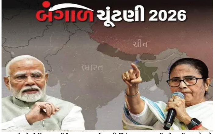
પ્લાન? ભોગોલિક રીતે ભારતને ઉત્તર-પૂર્વના રાજ્યો સાથે જોડતો સાંકડો રસ્તો એટલે 'ચિકન નેક'. આ હિન્દુ મતોનું પ્રચંડ ધ્રુવીકરણ કરવામાં સફળ રહે છે, તો મમતા બેનર્જી માટે સત્તા બચાવવી મુશ્કેલ બની શકે છે. અભિત શાહની '3000' વાળી સ્કીમ અને હવે આ વ્યૂહાત્મક ગોટવણી કરવા માંગે છે. પૂર્ણિયા એરપોર્ટ પર ભાજપના દિગ્ગજ નેતાઓની આ હલચલ સંકેત આપે છે કે સીમાંક વિસ્તારોમાં ભાજપ હવે 'આક્રમક

તારીખ- 25 ફેબ્રુઆરી 2026, જગ્યા- પૂર્ણિયા એરપોર્ટ. એરસ્ટ્રીપ પર બિહારના નાયબ મુખ્યમંત્રી સમ્રાટ ચૌધરી, કેન્દ્રીય ગૃહ રાજ્યમંત્રી નિત્યાનંદ રાય અને ભાજપના પ્રદેશ પ્રમુખ સંજય સરાવગી સહિત ઘણા નેતાઓ અને અધિકારીઓ ઉભા હતા. સાંજે લગભગ 5 વાગ્યે BSFનું એક ખાસ વિમાન ઉતરે છે અને તેની સાથે જ શરૂ થાય છે પશ્ચિમ બંગાળના રાજકારણને હચમચાવી દેનારી ભાજપની એ રણનીતિ, જેનું કેન્દ્ર છે 'ચિકન નેક' કોરિડોર. પશ્ચિમ બંગાળમાં તુણમૂલ કોંગ્રેસ (TMC) ની મજબૂતીનું સૌથી મોટું કારણ મુસ્લિમ બહુમતી ધરાવતા 6 જિલ્લાઓ છે. મુશિદાબાદ, માલદા, ઉત્તર દિનાજપુર, દક્ષિણ દિનાજપુર, દક્ષિણ 24 પરગણા અને ઉત્તર 24 પરગણા - આ એવા વિસ્તારો છે જ્યાંથી મમતા બેનર્જીને અડધાથી વધુ સીટો મળે છે. વર્ષોથી આ 'વોટ બેંક' મમતાના અબેદ કિલ્લા સમાન રહી છે. શું છે ભાજપનો 'ચિકન નેક' વિસ્તારોમાં ભાજપ હવે 'આક્રમક