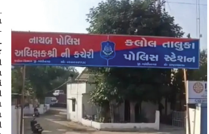
અગાઉ કંપનીના ડાયરેક્ટર પેમેન્ટ કરાવીને તેણે કંપનીનો સાથે સંપર્ક કરી માર્કેટિંગનું કામ કરવાની તૈયારી બતાવી હતી જે અન્યથે શરૂઆતમાં નાના ઓર્ડરો અપાવી સમયસર