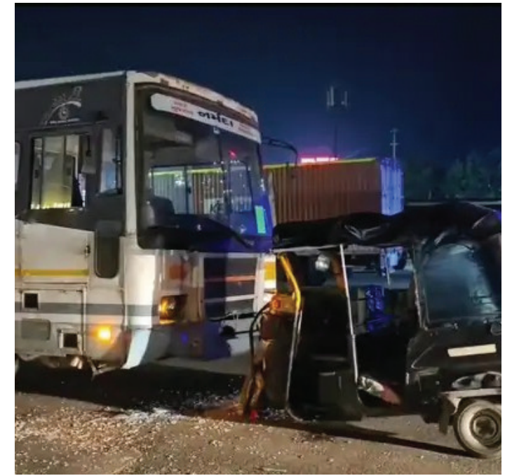
અહેવાલો અનુસાર, બસમાં સવાર થતા જ પોલીસ કાફલો સ્થળ પર દોડી તમામ ચૂંટણી કર્મીઓ સલામત છે ગયો હતો. પોલીસે અકસ્માતનો અને લોકશાહીના પર્વના મહત્વના ગુનો નોંધી, બસ અને રિક્ષા વચ્ચે ગણાતા EVM મશીનોને કોઈ ટક્કર કચા સંજોગોમાં થઈ તે દિશામાં નુકસાન પહોંચ્યું નથી. ઘટનાની જાણ વધુ તપાસ હાથ ધરી છે.

અંકલેશ્વર: GIDC બસ સ્ટેન્ડ પાસે ચૂંટણી સ્ટાફની બસ અને રિક્ષા વચ્ચે અકસ્માત, રિક્ષા ચાલક ઈજાગ્રસ્ત બસમાં રહેલા EVM મશીનો અને ચૂંટણી સ્ટાફનો આબાદ બચાવ થયો છે અંકલેશ્વર, અંકલેશ્વરના GIDC બસ સ્ટેન્ડ નજીક ગતરાત્રિએ ચૂંટણી ફરજ બજાવી પરત ફરી રહેલી બસ અને રિક્ષા વચ્ચે ગંભીર અકસ્માત સર્જાયો હતો. આ દુર્ઘટનામાં રિક્ષા ચાલકને ગંભીર ઈજાઓ પહોંચતા તેને તાત્કાલિક સારવાર અર્થે હોસ્પિટલ ખસેડવામાં આવ્યો હતો. સદનસીબે, બસમાં રહેલા EVM મશીનો અને ચૂંટણી સ્ટાફનો આબાદ બચાવ થયો છે. ઘટનાની વિગત મુજબ, વાલિયા રૂટ નંબર-૧૦ની બસ ચૂંટણી સ્ટાફ અને EVM મશીનો લઈને પરત ફરી રહી હતી, તે દરમિયાન GIDC બસ સ્ટેન્ડ પાસે બસ અને રિક્ષા વચ્ચે જોરદાર ટક્કર થઈ હતી. અકસ્માત એટલો ભયાનક હતો કે રિક્ષાનો કચ્ચર ઘાણ નીકળી ગયો હતો અને ચાલકને શરીરે ગંભીર ઈજાઓ થઈ હતી. સ્થાનિકોની મદદથી ઈજાગ્રસ્ત રિક્ષા ચાલકને તાત્કાલિક નજીકની હોસ્પિટલમાં સારવાર માટે ભરતી કરવામાં આવ્યો હતો. પ્રાથમિક