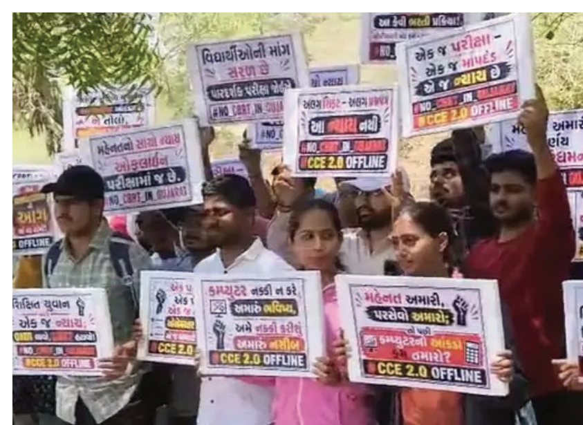
CBRT પદ્ધતિથી લેવામાં આવી ત્યારે અનેક વિસંગતતાઓ સર્જાઈ હતી. હાઈકોર્ટમાં પણ પિટિશનો દાખલ ખાસ કરીને 71 જેટલી અલગ અલગ શિફ્ટમાં લેવાયેલી પરીક્ષાઓમાં નોર્મલાઈઝેશન ફોર્મ્યુલાને કારણે અનેક તેજસ્વી વિદ્યાર્થીઓને અન્યાય થયો હોવાનું સામે આવ્યું છે. નોર્મલાઈઝેશનના ગણિતમાં ઉમેદવારોના વાસ્તવિક ગુણમાં 2થી લઈને 37 ગુણ સુધીનો મોટો તફાવત જોવા મળ્યો હતો. જેને પગલે ગુજરાત હાઈકોર્ટમાં પણ અનેક પિટિશનો દાખલ કરવામાં આવી હતી.

ગાંધીનગર : ગુજરાત ગૌણ સેવા પસંદગી મંડળ દ્વારા જાહેર કરવામાં આવેલી નવી સીસીઈ ગ્રુપ-એ અને ગ્રુપ-બીની ભરતીમાં પરીક્ષા લેવાની પદ્ધતિને લઈને વિવાદ છેડાયો છે. મંડળ દ્વારા આ વખતે પણ કોમ્પ્યુટર બેઝડ રિસ્પોન્સ ટેસ્ટ એટલે કે CBRT લેવાનું આયોજન કરતા રાજ્યભરના સ્પર્ધાત્મક પરીક્ષાની તૈયારી કરતા યુવાનોમાં ભારે રોષ અને અસંતોષની લાગણી વ્યાપી ગઈ છે. આજે ગાંધીનગરમાં મોટી સંખ્યામાં ઉમેદવારોએ આ આધુનિક ગણાતી પદ્ધતિ સામે વિરોધ નોંધાવી જૂની અને જાણીતી ઓફલાઈન OMR પદ્ધતિથી જ પરીક્ષા લેવાની સરકાર સમક્ષ માંગ કરી છે.