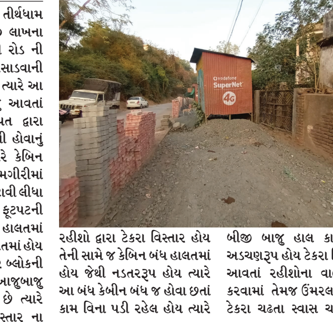
રહીશો દ્વારા ટેકરા વિસ્તાર હોય તેની સામે જ કેબિન બંધ હાલતમાં હોય જેથી નડતરૂપ હોય ત્યારે આ બંધ કેબીન બંધ જ હોવા છતાં કામ વિના પડી રહેલ હોય ત્યારે

ડભોઈ તાલુકાના તીર્થધામ યાણોદ ખાતે હાલ ૫૦ લાખના નવા બનેલા આરસીસી રોડ ની બાજુમાં પેવર બ્લોક બેસાડવાની કામગીરી ચાલી રહી છે ત્યારે આ ફૂટપાથ અને આજુબાજુ આવતાં કેબીન ધારકોને પંચાયત દ્વારા નોટિસ આપવામાં આવી હોવાનું જાણવા મળેલ છે ત્યારે કેબિન ધારકોએ સ્વેચ્છા એ કામગીરીમાં સહકાર આપે કેબીનો હટાવી લીધા હોય ત્યારે હજુ પણ ફૂટપાથની બાજુમાં એક કેબિન બંધ હાલતમાં લાંબા સમયથી બંધ હાલતમાં હોય જે હટાવેલ ન હોય ત્યારે બ્લોકની કામગીરી આજુબાજુ આજુબાજુ થતી જોવા મળી રહી છે ત્યારે શેષનારાયણ ટેકરા વિસ્તાર ના