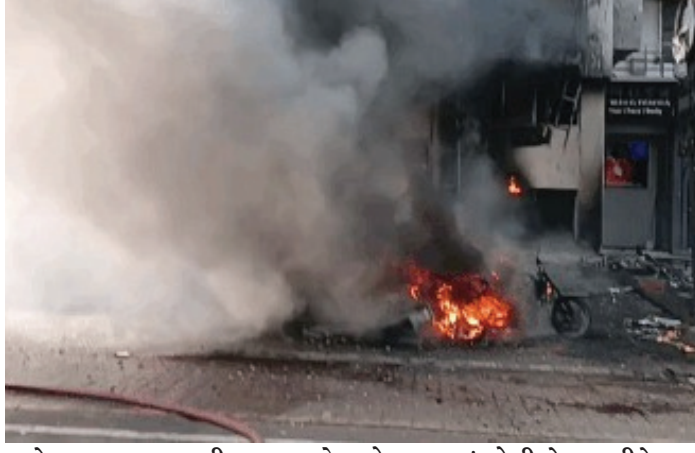
ભારે નુકસાન આગની જ્વાળાઓ બિલ્ડિંગના નીચેના ભાગ સુધી પ્રસરી જતાં પાર્કિંગમાં પડેલા અનેક વાહનો બળીને ખાખ થઈ ગયા હતા. માત્ર આગ એટલી તીવ્ર હતી કે ATM સહિત તેમાં રહેલી લાખો રૂપિયાની રોકડ રકમ પણ બળીને ખાક થઈ ગઈ હોવાના અહેવાલ પ્રાપ્ત થયા છે. ડાહલામાં ફાયર વિભાગ દ્વારા આગ લાગવાનું ચોક્કસ કારણ જાણવા માટે આર્થિક નુકસાન વેઠવાનો વારો આવ્યો છે. ATMમાં રહેલી રોકડ બળીને ખાક આ દુર્ઘટનામાં બિલ્ડિંગમાં આવેલું એક ATM પણ આગની ઝપેટમાં આવી ગયું હતું. આગ એટલી તીવ્ર હતી કે ATM સહિત તેમાં રહેલી લાખો રૂપિયાની રોકડ રકમ પણ બળીને ખાક થઈ ગઈ હોવાના અહેવાલ પ્રાપ્ત થયા છે. ડાહલામાં ફાયર વિભાગ દ્વારા આગ લાગવાનું ચોક્કસ કારણ જાણવા માટે આર્થિક નુકસાન વેઠવાનો વારો આવ્યો છે.

અમદાવાદ : અમદાવાદના શ્યામલ વિસ્તારમાં આવેલી શાંગરિલા-2 બિલ્ડિંગમાં આજે અચાનક ભીષણ આગ ફાટી નીકળતાં સમગ્ર વિસ્તારમાં અકરાતફરી મચી ગઈ હતી. આગ એટલી વિકરાળ હતી કે જોતજોતામાં તેણે બિલ્ડિંગના મોટા હિસ્સાને લપેટમાં લઈ લીધો હતો. ઘટનાની જાણ થતાં જ ફાયર બ્રિગેડની 8 ગાડીઓ તાત્કાલિક ઘટનાસ્થળે દોડી આવી હતી અને આગ પર કાબૂ મેળવવા માટે યુદ્ધના ધોરણે પ્રયાસો શરૂ કરવામાં આવ્યા હતા.