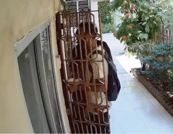
હતો અને ત્યારબાદ ચપ્પુ બતાવી તેમને બંધક બનાવી દીધા હતા. સોનાની ચેઈન, બંગડીઓ, વીંટીઓ તથા પતિની વીંટીઓ સહિત આશરે 10 તોલા સોનાના

વડોદરાના સમા વિસ્તારની સંતોષીનગર સોસાયટીમાં ગત 27 એપ્રિલના રોજ બપોરે એક વૃદ્ધ દંપતીને ચપ્પુની અણીએ બંધક બનાવી લૂંટ ચલાવનાર ગંગાનો કાઈમ બ્રાન્ચે પર્દાફાશ કર્યો છે. પોલીસે ટેકનિકલ સર્વેલન્સના આધારે ગણતરીના કલાકોમાં મુખ્ય સૂત્રધાર સહિત ત્રણ આરોપીઓની ઘરપકડ કરી કુલ 14.93 લાખનો મુદ્દામાલ જપ્ત કર્યો છે. બનાવના દિવસે કતેગજ પોલીસ મથકની હદમાં આવતા સમા વિસ્તારમાં બે લૂંટારાઓ દંપતીના ઘરમાં ઘૂસી આવ્યા હતા. આરોપીઓએ 'તમે મતદાન કર્યું છે કે નહીં?' તેમ પૂછીને દંપતીનો વિશ્વાસ કેળવ્યો