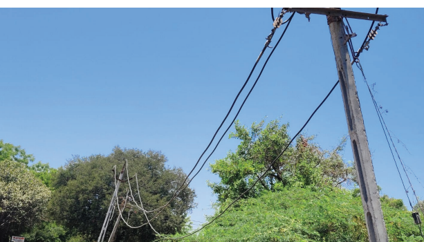
વારંવાર ફોલ્ટ પવન ફૂંકતા કે ડાળીઓ ઘસાતા વારંવાર લાઈનમાં ફોલ્ટ સર્જાય છે જેના કારણે કલાકો સુધી વીજ પુરવઠો ખોરવાય છે ગરમીનો કહેર હાલ ઉનાળાની સિઝન

ડભોઈ તાલુકાના મોટા હરીપુરા ગામમાં મધ્ય ગુજરાત વીજ કંપની લિમિટેડ (MGVCL) ની લાલચાવાડી સામે આવી છે. ગામમાંથી પસાર થતી મેન લાઈનના વાયરો ખેતરો અને રસ્તાઓ પર ઉગી નીકળેલા ગાંડા બાવળો તેમજ અન્ય વૃક્ષોની ડાળીઓમાં ફસાયેલા હોવાથી વારંવાર શોર્ટ સર્કિટ અને પાવર કટની સમસ્યા સર્જાઈ રહી છે. કાળજાળ ગરમીમાં વીજળી ગુલ થતા ગ્રામજનોમાં ભારે રોષ જોવા મળી રહ્યો છે જોખમી લાઈનને મેન લાઈનના વાયરો ઘણા સ્થળોએ નીચા નમી ગયા છે અને ઝાડી-ઝાંખરામાં અટવાયેલા છે.