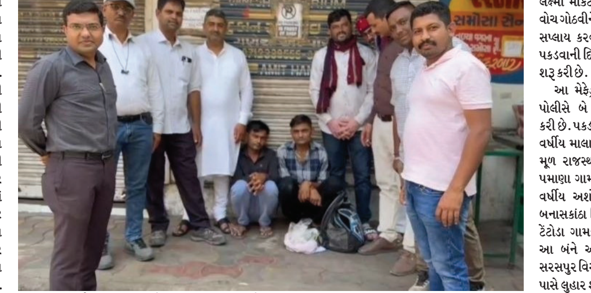
જથ્થો, 3 મોબાઈલ ફોન, 3500 રૂપિયા રોકડા અને અન્ય બેગ મળીને કુલ 12,59,000 રૂપિયાનો મુદ્દામાલ જપ્ત કરી ગુનો નોંધ્યો છે. આ ડ્રગ્સ આરોપી કોની પાસેથી લાવ્યા હતા પોલીસે ઘીકાંટામાં નવતાડ પોળની સામે,

ચૂંટણીને ધ્યાનમાં રાખીને અમદાવાદમાં કાર્યદો અને પોલીસ સતત એલર્ટ મોડ પર છે. આ પેટ્રોલીંગ દરમિયાન અમદાવાદ કાર્પમ બ્રાન્ચની ટીમને મોટી સફળતા હાથ લાગી છે. પોલીસે બાતમીના આધારે કાર્યવાહી કરીને ઘીકાંટા વિસ્તારમાંથી 12 લાખથી વધુના મેફેડ્રોન સાથે બેની ધરપકડ કરી છે. ડ્રગ્સ સપ્લાયરને પકડવા પોલીસે તપાસ શરૂ કરી કાર્પમ બ્રાન્ચને બાતમી મળી હતી. આ માહિતીના આધારે ગઈકાલે રોજ પોલીસે ઘીકાંટામાં નવતાડ પોળની સામે, લક્ષ્મી માર્કેટ નીચે આવેલ રોડ ઉપર વોચ ગોઠવીને રેઈડ કરી હતી. આ સ્થળેથી પસાર થતા અને ડ્રગ્સ લઈને જતા શખસોને પોલીસે રસ્તાબંધ ઝડપી લીધા હતા. પોલીસે તેમની પાસેથી પાસ પરમીટ વગરનો 412 ગ્રામ મેફેડ્રોન ડ્રગ્સનો