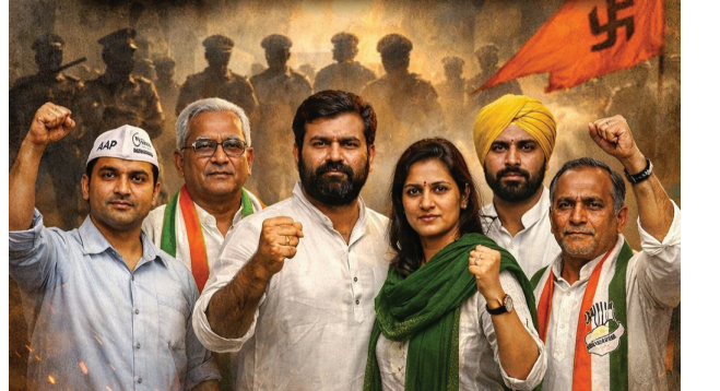
મેં હે' - આજે આ જંગમાં સાર્થક થતું દેખાય છે. આ લડાઈ ઈરાન કે યુકેના યુદ્ધ કરતાં પણ વધુ મહત્વની છે, કારણ કે આ લડાઈ ભારતની આંતરિક આઝાદી અને અસ્તિત્વની છે. તકાવત સમજો: પ્રભુ રામ અને 'ભાજપના રામ' મેદાને પડેલા આ લડવૈયાઓને કદાચ ભગવાન રામમાં

• અમદાવાદ: ગુજરાતમાં અત્યારે ચૂંટણીનો માહોલ છે, પણ આ માહોલમાં લોકશાહીના ઉત્સવ કરતાં સત્તા પક્ષની 'દાદાગીરી'નો ધુમાડો વધુ દેખાઈ રહ્યો છે. ભાજપ, પોલીસ અને રાજ્ય સરકારની સીધી કે આડકતરી ધમકીઓ છતાં જે ઉમેદવારોએ કોંગ્રેસ કે આમ આદમી પાર્ટી તરફથી મેદાન પકડ્યું છે, તે તમામ ખરેખર અભિનંદનના અધિકારી છે. જ્યારે સત્તાનો નશો માથે ચડીને બોલતો હોય, ત્યારે તેની સામે પૂરના પ્રવાહમાં તરવું એ નાનીસૂની વાત નથી. પોલીસ સ્ટેશન કે ભાજપનું કાર્યાલય? આ તે કેવી લોકશાહી કે જ્યાં પોલીસ વિપક્ષના ઉમેદવારોને સ્ટેશને બોલાવી ફોર્મ પાછું ખેંચવા દબાણ કરે છે? આ આચરણ ભાજપ, તેની સરકાર અને તેની જનતા ગણતંત્ર RSSનું અસલી ચારિત્ર્ય છતું કરે છે. જોકે, આમાં નવાઈ પામવા જેવું પણ નથી. નરેન્દ્ર મોદી જ્યારે મુખ્યમંત્રી હતા, ત્યારે પણ ધારાસભ્યોને DSP કચેરીએ બોલાવી કોરા કાગળ પર સહી કરાવી લેવાતી હતી જેથી તેઓ વિધાનસભામાં પ્રશ્નો ન પૂછી શકે. આ જ જૂની પદ્ધતિ હવે નવા સ્વરૂપે સમગ્ર રાજ્યમાં જોવા મળી રહી છે. 'સરકારે શી કી તમજા' સાથે રણમદાનમાં આજે જે ઉમેદવારો વિપક્ષમાંથી લડી રહ્યા છે, તેમને બરાબર ખબર છે કે સામે 'કાલિલ' કેટલો શક્તિશાળી છે. આઝાદીની લડાઈ વખતે વાતનું ગીત. 'સરકારે શી કી તમજા' અબ હમારે દિલ મેં હે, દેખના હે ઝોર કિતના બાજુ-એ-કાલિલ