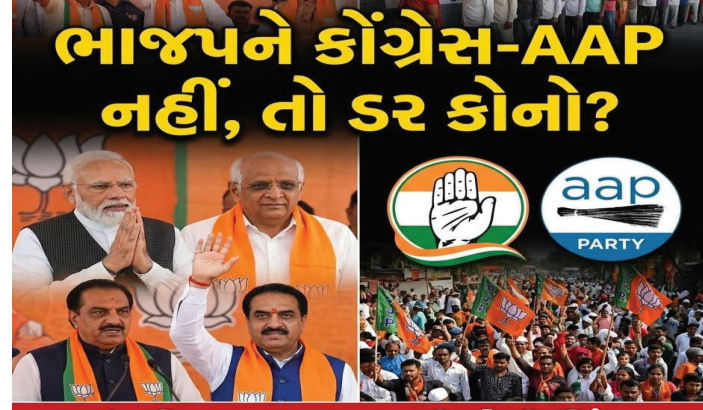
આંતરિક બગાવત બની મોટી ચિંતા!

ગુજરાતમાં 2026ની સ્થાનિક સ્વરાજ્યની ચૂંટણીનો જંગ જામી રહ્યો છે ત્યારે રાજકીય કલક પર એક ચોકાવનારી વિગત ઉભરી રહી છે. વધોથી અજેય મનાતી ભારતીય જનતા પાર્ટી માટે આ વખતે ખતરો કોંગ્રેસ કે આમ આદમી પાર્ટી (AAP) નથી, પરંતુ પક્ષનો પોતાનો 'આંતરિક અસંતોષ' છે. ટિકિટ ફાળવણીમાં નવા ચહેરાઓને પ્રાધાન્ય અને જૂના જોગીઓની બાદબાકીને કારણે ભાજપના ગઠમાં જ ગાબડાં પડવાની ભીતિ સેવાઈ રહી છે.