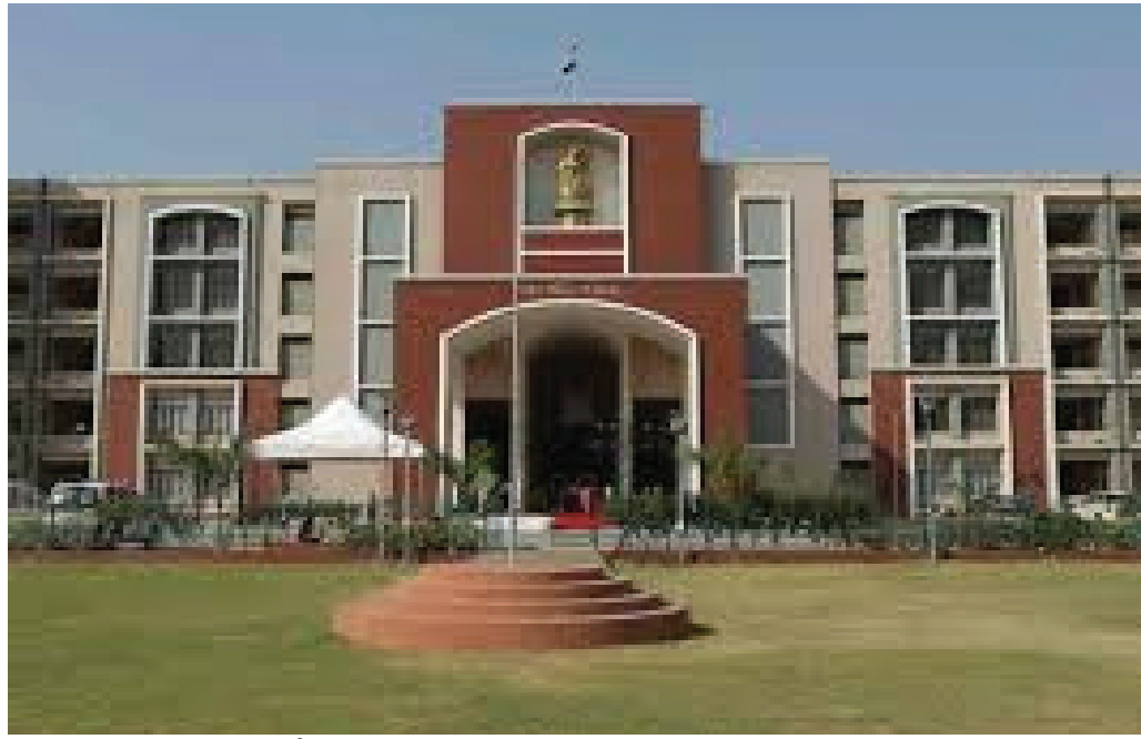
પેતીની જમીન ખરીદવા માટે ૨૪ જુલાઈ, ૨૦૦૭ના રોજ જમીન માલિક (સાંકરદારા સયુક્ત સહકારી મંડળી) અને અન્ય સભ્યો સાથે એક એમઓયુ કરવામાં આવ્યું હતું. આ સોદો કુલ રૂ. ૮.૨૨ કરોડમાં નક્કી થયો હતો, જેમાંથી બીસીએએ ૫૦ ટકા રકમ એટલે કે રૂ. ૪.૧૧ કરોડ બાના પેટે ચૂકવ્યા હતા.