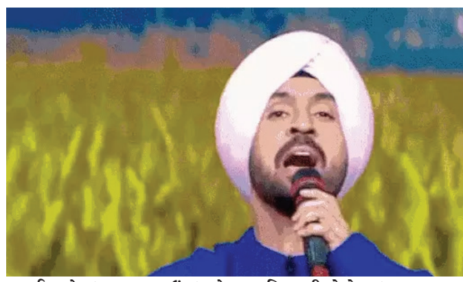
કંસાઈ ગયો છું. ભારત જાઉં છું, તો ત્યાં ઘણા લોકો કહે છે કે ખાલિસ્તાની આવી ગયો. જ્યારે હું વિદેશમાં આવું છું, તો આ લોકો કહે છે કે ભારતનો માણસ આવી ગયો. આવી સ્થિતિમાં હું શું કરું? ક્યારેક-ક્યારેક મને લાગે છે કે, હું સાચા રસ્તે ચાલી રહ્યો છું.' અમિતાભ બચ્ચનને પગે લાગવા પર ખાલિસ્તાનીઓએ વિવાદ ઊભો કર્યો હતો. 30 એપ્રિલે

'દિલજીતે આ પહેલા KBC (કોન બનેગા ક્રોડપતિ) શોમાં અમિતાભ બચ્ચનના પગ સ્પર્શીને ખોટું કર્યું.' જોકે, દિલજીત આ મામલે કહી ચૂક્યો છે કે તે અમિતાભના શોમાં પંજાબીઓ અને પૂર પીડિતો માટે ફંડ એકત્ર કરવા ગયો હતો, ન કે પોતાના પ્રમોશન માટે. 'ચમકીલા'ને જાણી જોઈને બાળકો સુધી પહોંચાડ્યો: ખાલિસ્તાનીએ દિવંગત પંજાબી સિંગર અમરજીત ચમકીલાને લઈને બનાવેલી ફિલ્મને લઈને પણ દિલજીત દોસાંએ ધમકાવ્યો. ખાલિસ્તાનીએ કહ્યું કે, 'જે ચમકીલાનું પંજાબમાંથી નામ ભૂંસી નાખવામાં આવ્યું હતું, તેને દિલજીતે ફરીથી બાળકો-બાળકો સુધી પહોંચાડી દીધો.' દિલજીતે ખાલિસ્તાની ઝંડા બતાવવાને લઈને થયેલા વિવાદ પર 2 મેના રોજ એડમન્ટન (કેનેડા) માં શો દરમિયાન કહ્યું- 'હું તો વચ્ચે