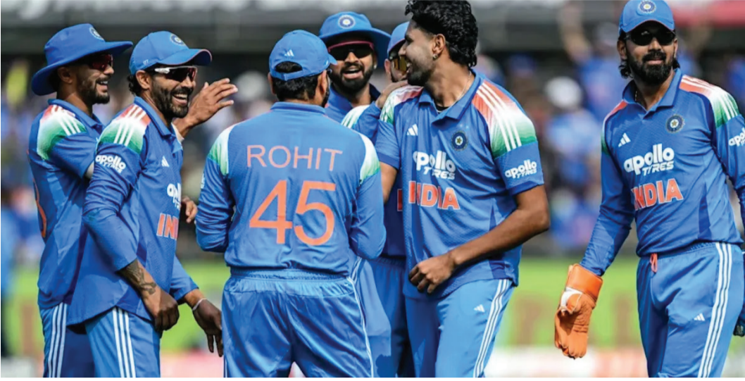
સાથે ત્રીજા ક્રમે છે. સોથી મોટો ફેરફાર યોગા અને પાંચમા ક્રમે જોવા મળ્યો છે, જ્યાં દક્ષિણ આફ્રિકાએ પાકિસ્તાનને પછાડીને ચોથું સ્થાન મેળવી લીધું છે. દક્ષિણ આફ્રિકા હવે 102 પોઈન્ટ્સ સાથે ચોથા સ્થાને પહોંચી ગયું છે, જ્યારે પાકિસ્તાન 98 પોઈન્ટ્સ સાથે પાંચમા સ્થાને પહોંચી ગયું છે. અન્ય ટીમોની વાત કરીએ તો શ્રીલંકા (96) છઠ્ઠા, અફઘાનિસ્તાન (93) સાતમા, ઈંગ્લેન્ડ (89) આઠમા, બાંગ્લાદેશ (84) નવમા અને વેસ્ટ ઈન્ડિઝ (74) દસમા ક્રમે છે.

ઈન્ટરનેશનલ ક્રિકેટ કાઉન્સિલ એટલે કે ICC દ્વારા જાહેર કરવામાં આવેલા ODI રેન્કિંગમાં ભારતીય ટીમે પોતાનું નંબર-1નું સ્થાન જાળવી રાખ્યું છે. વાર્ષિક અપડેટ બાદ પણ ટીમ ઈન્ડિયા વિશ્વની સર્વશ્રેષ્ઠ વનડે ટીમ તરીકે ઉભરી આવી છે. જોકે, આ વખતે ભારતની લીડમાં થોડો ઘટાડો થયો છે, જે હવે આગામી સમયમાં નંબર-1ના તાજ માટે જંગ વધુ રોમાંચક બનાવશે. ભારત નંબર વન પણ ન્યૂઝીલેન્ડ અને ઓસ્ટ્રેલિયાએ ટેન્શન વધાર્યું. ભારતીય ટીમ હાલ 118 રેટિંગ પોઈન્ટ્સ સાથે પ્રથમ સ્થાને છે.