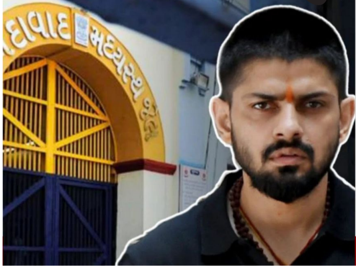
દક્ષિણ એશિયન મૂળના વેપારીઓ નિશાને : ગન પોઈન્ટ પર વસુલાત અને ડ્રગ્સના નેટવર્કમાં વિદ્યાર્થીઓનો ઉપયોગ