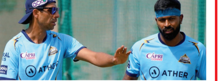
મુંબઈમાં લાવવાનો નિર્ણય કારગત નીવડ્યો નથી. જો મુંબઈ હાર્દિકને લાવવા માંગતું હતું, તો તેમણે આશિષ નેહરાને પણ સાથે લાવવા જોઈતા હતા. તે એક 'પેકેજ ડીલ' જેવું હોત. નેહરા વગર હાર્દિક મુંબઈને જ સફળ કરી શક્યો નથી જે તેણે ગુજરાત ટાઈટન્સ માટે કર્યો હતો.

આઈપીએલ 2026 માં મુંબઈ ઈન્ડિયન્સનું પ્રદર્શન અત્યંત નિરાશાજનક રહ્યું છે. પાંચ વખતની ચેમ્પિયન ટીમ પ્લેઓફની રેસમાંથી બહાર ફેંકાઈ ગઈ છે. હવે મુંબઈ ઈન્ડિયન્સના મેનેજમેન્ટ પર હાર્દિક પંડ્યાને કેપ્ટન પદ પરથી હટાવવાનું દબાણ વધી રહ્યું છે. બુમરાહને કમાન સોંપવાની સલાહ પૂર્વ ક્રિકેટર સંજય માંજરેકરે મુંબઈ ઈન્ડિયન્સના મેનેજમેન્ટને આકરા શબ્દોમાં સલાહ આપી છે કે હવે હાર્દિક પંડ્યાને કેપ્ટન પદ પરથી મુક્ત કરવાનો સમય આવી ગયો છે. માંજરેકરે સ્પષ્ટપણે જણાવ્યું હતું કે જસપ્રીત બુમરાહ ટીમનું નેતૃત્વ કરવા માટે શ્રેષ્ઠ વિકલ્પ છે. કારણ કે તે