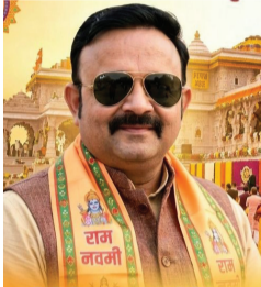
સરકારે હવે આ 'કાપ'ના નાટકમાંથી બહાર આવીને કાયમી નૈતિકતા બતાવવી પડશે.

સરકારે હવે આ 'કાપ'ના નાટકમાંથી બહાર આવીને કાયમી નૈતિકતા બતાવવી પડશે. 1. ખોટા ખર્ચને ગુનો જાહેર કરો: જનતાના પૈસાનો બગાડ કરનારા અધિકારીઓ અને નેતાઓ પાસેથી વસૂલાત થવી જોઈએ. 2. શૈતપત્ર જાહેર થાય: ક્યા વિભાગે ક્યાં બિનજરૂરી ખર્ચ કર્યો તેનો હિસાબ જનતા સામે ખુલ્લો મૂકવો જોઈએ. અંતિમ વાત: જનતા હવે જાગૃત છે. 'ખોટા ખર્ચ પર કાપ'ની હેડલાઈનો બનાવીને વાહવાહ મેળવવાનું બંધ કરો. જે ખોટું છે, તે હંમેશા માટે બંધ થવું જ જોઈએ-પછી ભલે તિજોરી છલકાતી હોય કે ખાલી હોય!