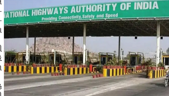
આ મહાપરિયોજનાના નિર્માણ કાર્યમાં ગતિશીલતા લાવવા માટે એનએચએઆઈએ પ્રોજેક્ટને બે સમર્પિત જૂથમાં વહેંચી નાખ્યો છે.

એક ટીમ પશ્ચિમના ૩૪૮ કિ.મી.નું કામ કરશે જ્યારે બીજી ટીમ પૂર્વના બાકીના ભાગમાં કામ શરૂ કરશે. શરૂઆતમાં આ એક્સપ્રેસ વે ૪ રજિસ્ટ્રેશન ઉપર પણ રોક મુકવામાં આવી છે. પહોળો કરાશે. આ પ્રોજેક્ટ ૨૦૩૦ સુધીમાં પૂરો કરવાનો છે.