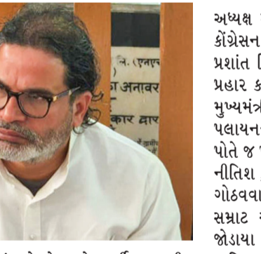
આવેલો એક મોટો બંગલો છે અને પાર્ટીના રાષ્ટ્રીય અધ્યક્ષ અને પૂર્વ સાંસદ ઉદયસિંહના પરિવારનો છે. ઉદયસિંહ એક જાણીતા રાજકીય પરિવારમાંથી આવે છે, તેમના ભાઈ એન.કે. સિંહ 15મા નાણા પંચના ભૂતપૂર્વ

I-PACના સહ-સ્થાપક પ્રશાંત કિશોરે 2024માં 'જન સુરાજ પાર્ટી'ની સ્થાપના કરી હતી, અને પોલિટિકલ કન્સલ્ટન્સી છોડી દીધી હતી. તેઓ અત્યાર સુધી 'શેખરપુરા હાઉસ'થી કાર્યરત હતા, જે પટણા એરપોર્ટ નજીક