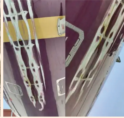
લેન્ડિંગમાં મુશ્કેલી આવી શકે છે, તેથી તેણે નિયમો અનુસાર 'ગો-અરાઉન્ડ' કરવાનો નિર્ણય લીધો. ગો-અરાઉન્ડ દરમિયાન

પાયલટ લેન્ડિંગ એપ્રોચ દરમિયાન ફ્લાઈટને ફરીથી હવામાં લઈ જાય છે અને સ્થિતિ સામાન્ય થતાં ફરીથી લેન્ડિંગનો પ્રયાસ કરે છે.