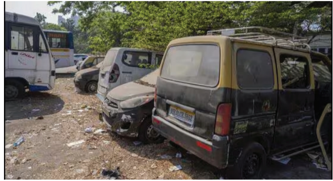
કારણે કમ્પાઉન્ડમાં કચરો અને ભંગાર બની રહ્યા છે. કરોડોનો મુદ્દામાલ ધૂળખાણી: જવાબદાર કોણ?

પોલીસ સ્ટેશન એટલે કાયદો અને વ્યવસ્થાનું પ્રતીક, જ્યાં ગુનેગાર કાંપે અને સામાન્ય નાગરિક ન્યાયની આશાએ જાય. પરંતુ ઊંટાઉંટીપુર જિલ્લાના સંખેડા પોલીસ સ્ટેશનના કમ્પાઉન્ડની તસવીરો કંઈક જુદી જ કહાની બયાન કરી રહી છે. સંખેડા પોલીસ સ્ટેશનની હદમાંથી અલગ-અલગ ગુનાઓમાં જપ્ત કરાયેલી મુદ્દામાલની કાર અને અન્ય વાહનોની દયાનિયમિત સ્થિતિ જોઈને હવે પોલીસની કામગીરી સામે ગંભીર સવાલો ઊભા થયા છે. લાખો રૂપિયાની કિંમતના વાહનો આજે પોલીસની લાપરવાહીને