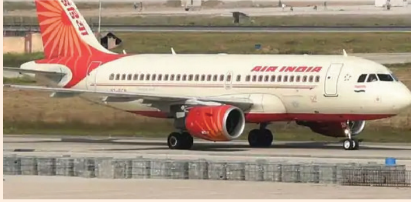
સોશિયલ મીડિયા પર અકસ્માત બાદ ફ્લાઈટની તસવીરો સામે આવી છે. જોકે, બાસ્કર તેની પુષ્ટિ કરતું નથી.