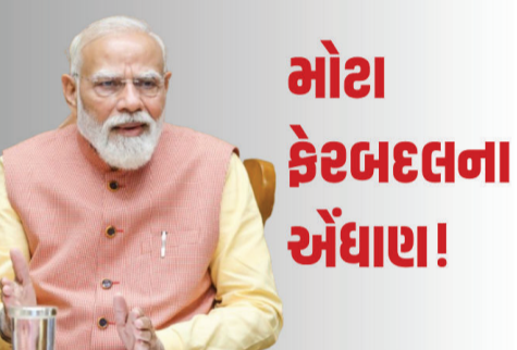
મોટા ફેરબદલના અંધાણ!

નવી દિલ્હીમાં વડાપ્રધાન નરેન્દ્ર મોદીની અધ્યક્ષતામાં ગુરુવારે કેન્દ્રીય મંત્રી પરિષદની એક અત્યંત મહત્વની અને લાંબી બેઠક યોજાઈ હતી. લગભગ સાડા ચાર કલાક ચાલેલી આ મેરથોન બેઠકમાં પીએમ મોદીએ તમામ મંત્રીઓને આગામી સમય માટે સ્પષ્ટ રોડમેપ આપી દીધો છે. આવતા મહિને કેન્દ્રમાં મોદી સરકાર પોતાના સફળ વિવિંગ' (સરળ જીવન), 'ઈઝ ઓફ ડુઈંગ બિઝનેસ' (વિવારમાં સરળતા)ને પ્રોત્સાહન આપવા અને આપણા સહિયારા સપના 'વિકસિત ભારત'ને સાકાર કરવા માટે સુધારાને કેવી રીતે આગળ વધારવા તે અંગે વિચારો અને શ્રેષ્ઠ પદ્ધતિઓની આપ-લે કરી.' સૂત્રોના જણાવ્યા અનુસાર, બંધ બારણે યોજાયેલી આ બેઠકમાં વડાપ્રધાને મંત્રીઓને મંત્રીઓને સ્પષ્ટ શબ્દોમાં કહ્યું કે, ભૂતકાળમાં શું થયું તે ભૂલી જાઓ, હવે માત્ર ભવિષ્ય પર ધ્યાન કેન્દ્રિત કરો. તેમણે સ્પષ્ટ કર્યું કે દરેક મંત્રાલયે 'વિકસિત ભારત 2047'ના વિઝનને નજરમાં રાખીને કામ કરવું પડશે. પીએમ મોદીએ ભારપૂર્વક જણાવ્યું કે સુધારાઓ માત્ર કાગળ પર ન રહેવા જોઈએ, પરંતુ તેનાથી સામાન્ય નાગરિકો માટે શાસન વ્યવસ્થા વધુ ઝડપી, સરળ અને અસરકારક બનવી જોઈએ. આ હાઈ-પ્રોફાઇલ મીટિંગમાં 9 મહત્વના વિભાગો દ્વારા વડાપ્રધાન સમક્ષ પ્રેઝન્ટેશન રજૂ કરવામાં આવ્યા હતા. જેમાં કૃષિ, વન, શ્રમ, માગ પરિવહન, કોર્પોરેટ અફેર્સ, વિદેશ મંત્રાલય, વાણિજ્ય અને ઊર્જા મંત્રાલયનો સમાવેશ થાય છે. પીએમ મોદીએ મંત્રીઓને આદેશ આપ્યો છે કે ઓફિસોમાં બિનજરૂરી અમલદારશાહીના કારણે કાઈલો અટકવી ન જોઈએ. ફાઈલોની અવરજવર સુપરફાસ્ટ થવી જોઈએ જેથી ઉપલબ્ધ સમયનો મહત્તમ સદુપયોગ થઈ શકે.