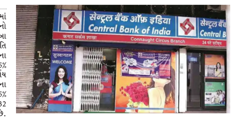
OFS નોન-રીટેલ રોકાણકારો માટે 22 મે 2026 ના રોજ ખુલશે. જ્યારે, રીટેલ રોકાણકારો અને બેંકના કર્મચારીઓ આ ઈશ્યુ માટે 25 મે 2026 ના રોજ પોતાની બોલી લગાવી શકશે. બંને દિવસોએ ટ્રેડિંગ દરમિયાન સવારે 9:15 વાગ્યાથી બપોરના 3:30 વાગ્યા સુધી બોલી લગાવી શકાય છે. બેઝ ઓફરમાં 4% હિસ્સેદારી, માગ રહેતા 4% વધારાના વેચવાનો વિકલ્પે જ ઓફર હેઠળ સરકાર 4% એટલે કે 36,20,56,051 ઈક્વિટી શેર વેચશે. જો રોકાણકારોની માગ સારી

સરકારે સેન્ટ્રલ બેંક ઓફ ઈન્ડિયામાં ઓફર ફોર સેલ (OFS) દ્વારા પોતાનો 8% હિસ્સો વેચવાનો નિર્ણય કર્યો છે. આ OFS માટે સરકારે ફ્લોર પ્રાઈસ 31 પ્રતિ શેર નક્કી કરી છે, જે બેંકના ગુરુવારના ક્લોઝિંગ પ્રાઈસ 33.94 કરતાં 8.5% થી વધુના રિસ્કાઉન્ટ પર છે. આ નિર્ણય પછી આજે એટલે કે શુક્રવાર, 22 મેના રોજ બજારમાં સેન્ટ્રલ બેંકના શેરમાં 5% થી વધુનો ઘટાડો જોવા મળ્યો છે. તે 32 રૂપિયાની આસપાસ ટ્રેડ કરી રહ્યો છે. એક મહિનામાં તે 13% થી વધુ ટૂંક્યો છે. નોન-રીટેલ અને રીટેલ રોકાણકારો માટે OFS અલગ-અલગ દિવસે ખુલશે. રિપાઈમેન્ટ ઓફ ઈન્વેસ્ટમેન્ટ એન્ડ પબ્લિક એસેટ મેનેજમેન્ટ (DIPAM) દ્વારા જાહેર કરાયેલી નોટિસ મુજબ, આ રહેશે તો સરકાર આટલા જ વધુ શેર વેચશે. વર્તમાનમાં સેન્ટ્રલ બેંક ઓફ ઈન્ડિયામાં સરકારની હિસ્સેદારી 89.27% છે. સરકારની આ હિસ્સેદારીનું વેચાણ સરકારની વિનિવેશ અને પબ્લિક શેરહોલ્ડિંગ નિયમોના પાલનની રક્ષાનીતિનો ભાગ છે. ઓફર ડોક્યુમેન્ટ અનુસાર, નોન-રીટેલ રોકાણકારો માટે અનામત રાખવામાં આવેલા શેરોમાંથી ઓછામાં ઓછો 25% હિસ્સો મ્યુચ્યુઅલ ફંડ અને ઈન્વેસ્ટમેન્ટ કંપનીઓને ફાળવવામાં આવશે. જોકે, આ માટે જરૂરી છે કે તેમની બોલીઓ ફ્લોર પ્રાઈસ અથવા તેનાથી ઉપરની કિંમતે મળે. નોન-રીટેલ રોકાણકારો તેમની ફાળવણી ન થયેલી બિડ્સને બીજા દિવસે (T+1 day) માટે પણ કરી શકે છે.