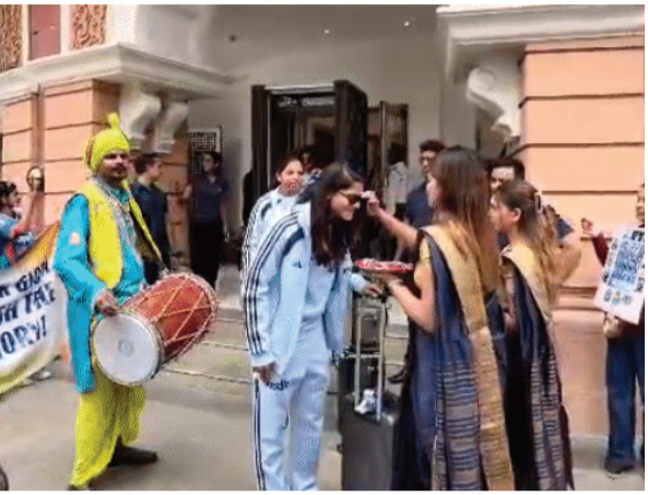
બાંગ્લાદેશ અને ઓસ્ટ્રેલિયા સામે રમશે. ટુર્નામેન્ટમાં 12 ટીમને 6-6ના બે ગ્રુપમાં વહેંચવામાં આવી છે. દરેક ગ્રુપમાંથી 2 ટીમ સેમિફાઇનલમાં પ્રવેશ નેધરલેન્ડ્સ, સાઉથ આફ્રિકા,

ઓસ્ટ્રેલિયા સૌથી સફળ ટીમ રહી છે વુમન્સ T20 વર્લ્ડ કપના ઇતિહાસમાં ઓસ્ટ્રેલિયા સૌથી સફળ ટીમ રહી છે. ઓસ્ટ્રેલિયાએ અત્યાર સુધી રેકોર્ડ 6 વખત ખિતાબ પોતાના નામે કર્યો છે અને ઘણી વખત ફાઇનલ સુધી પહોંચીને પોતાની બાદશાહત સાબિત કરી છે. આ ઉપરાંત ઇંગ્લેન્ડે 2009માં પ્રથમ એશિયન જીતીને ઇતિહાસ રચ્યો હતો, જ્યારે વેસ્ટ ઈન્ડીઝે 2016માં ખિતાબ જીત્યો હતો. અને ઉલ્લેખનીય છે કે ટીમ હરમનપ્રીત કોરની આગેવાની હેઠળ મેદાનમાં ઉતરશે, જેણે ગયા વર્ષે ભારતને પહેલીવાર મહિલા વન-ડે વર્લ્ડ કપ જીતાડ્યો હતો. તે ટીમની 11 ખેલાડીઓ સ્કવોડનો ભાગ છે.