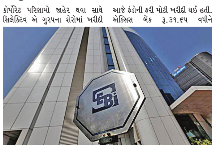
સામે કેટલાક શેરોમાં વેચવાલી થઈ હતી. સેન્સેક્સ ૭૫૨૩૦થી ૭૫૨૧૧ વચ્ચે અથડાઈ અંતે ૨૩૧.૯૮ પોઈન્ટ વધીને ૭૫૪૧૫.૩૫ બંધ રહ્યો હતો. નિકટી ૫૦ સ્પોટ રહેઠાણથી ૨૩૮૩૬ વચ્ચે અથડાઈ અંતે ૬૪.૬૦ પોઈન્ટ વધીને ૨૩૭૧૯.૩૦ બંધ રહ્યો હતો. બેંકિંગ-ફાઈનાન્સ શેરોમાં