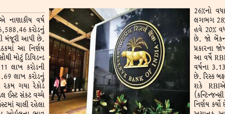
કામ કરશે. તેનાથી સરકારને ખાતર અને ઈંધણ પર આપવામાં આવતી સબસિડીના વધતા ખર્ચને સંભાળવામાં મદદ મળશે. રિઝર્વ બેંકે જણાવ્યું કે ગયા વર્ષની સરખામણીમાં તેની કુલ કમાણીમાં લગભગ