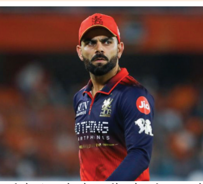
કુમારની ઓવરમાં સતત મોટા શોટ્સ રમીને રન એકઠા કરી રહ્યા હતા, ત્યારે

ઈન્ડિયન પ્રીમિયર લીગ (IPL) 2026માં શુક્રવારે (22મી મે) રોયલ ચેલેન્જર્સ બેંગ્લોર (RCB) અને સનરાઈઝર્સ હૈદરાબાદ (SRH) વચ્ચે એક હાઈ-વોલ્ટેજ મુકાબલો રમાયો હતો. હૈદરાબાદના રાજીવ ગાંધી ઈન્ટરનેશનલ સ્ટેડિયમમાં રમાયેલી આ મેચમાં માત્ર યોગ્યા-છગાનો વરસાદ જ જોવા ન મળ્યો, પરંતુ વિરાટ કોહલી અને ટ્રેવિસ હેડ વચ્ચે મેદાન પર થયેલી ગરમાગરમ બોલાચાલી અને 'શીત યુદ્ધ'એ સોશિયલ મીડિયા પર ચાહકોનું સૌથી વધુ ધ્યાન ખેંચ્યું છે. મેચ પૂરી થયા બાદ બંને ખેલાડીઓએ હાથ પાળ મિલાવ્યા ન હોવાના વીડિયો વાઈરલ થતાં વિવાદ વધુ ઘેરો બન્યો છે. મેચ દરમિયાન વિરાટ કોહલી ભારે આક્રમક મુડમાં જોવા મળ્યો હતો. આરસીબીના બેટર વેંકટેશ એચર જ્યારે શિવાંગ