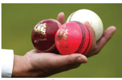
ટેસ્ટ મેચ સંપૂર્ણપણે પિંક બોલથી જ રમાય છે. ક્રિકેટ અનુસાર, ફેરફારો સંબંધિત પ્રસ્તાવો ગુરુવારે ICC ચીફ એક્ઝિક્યુટિવ કમિટી (CEC)ની વર્ચ્યુઅલ બેઠકમાં રજૂ કરવામાં આવ્યા હતા. ICC ક્રિકેટ કમિટીના પ્રમુખ સોરવ ગાંગુલી પણ બેઠકમાં હાજર રહ્યા હતા. આ પ્રસ્તાવો પર 30 મેના રોજ અમદાવાદમાં યોજનારી ICC બોર્ડ બેઠકમાં ચર્ચા કરવામાં આવશે અને મંજૂરી મળ્યા બાદ નવા નિયમો 1 ઓક્ટોબરથી લાગુ કરી શકાય છે. વન-ડેમાં દરેક ઇન્નિંગમાં બે ટ્રિક્સ બ્રેક હોય છે. હાલમાં ટ્રિક્સ બ્રેક દરમિયાન માત્ર સબસ્ટિટ્યુટ ખેલાડીઓ જ મેદાન પર જઈ શકે છે. તેમાં પણ ટ્રિક્સ લઈ જનારા ખેલાડીઓનું ક્રિકેટ ટ્રેસમાં હોવું ફરજિયાત છે. પ્રસ્તાવ મુજબ, હેડ કોચને પણ ખેલાડીઓ સાથે વાત કરવા માટે મેદાન પર આવવાની મંજૂરી મળશે.

ICC ક્રિકેટના ત્રણેય કોર્મટમાં મોટા ફેરફારોની તૈયારી કરી રહી છે. સૌથી મહત્વપૂર્ણ પ્રસ્તાવ રેડ બોલથી શરૂ થયેલી ક્રોઈપલ ટેસ્ટ મેચની વચ્ચે પિંક બોલનો ઉપયોગ કરવાનો છે. બોલ એવી પરિસ્થિતિઓમાં બદલવામાં આવશે જ્યારે ખરાબ લાઈટને કારણે રમત રોકી દેવામાં આવી હોય. રેડ બોલ ફ્લડ લાઈટ્સમાં ખરાબ દેખાતો નથી. જ્યાં સુધી ખરાબ લાઈટ હોય ત્યાં સુધી રેડ બોલની જગ્યાએ પિંક બોલથી રમત રમાય. જોકે, આ માટે મેચ રમી રહેલી બંને ટીમના કેપ્ટનોએ સંમતિ આપવી પડશે. આ પ્રસ્તાવ ફક્ત દિવસ દરમિયાન રમાતી ટેસ્ટ મેચ માટે છે. સાથે જ, આ નિયમો ફક્ત તે જ મેદાનો પર લાગુ થઈ શકે છે જ્યાં પહેલાથી ફ્લડ લાઈટ્સ લગાવેલી હોય. ડે-નાઈટ રમવા હતા. આ પ્રસ્તાવો પર 30 મેના રોજ અમદાવાદમાં યોજનારી ICC બોર્ડ બેઠકમાં ચર્ચા કરવામાં આવશે અને મંજૂરી મળ્યા બાદ નવા નિયમો 1 ઓક્ટોબરથી લાગુ કરી શકાય છે. વન-ડેમાં દરેક ઇન્નિંગમાં બે ટ્રિક્સ બ્રેક હોય છે. હાલમાં ટ્રિક્સ બ્રેક દરમિયાન માત્ર સબસ્ટિટ્યુટ ખેલાડીઓ જ મેદાન પર જઈ શકે છે. તેમાં પણ ટ્રિક્સ લઈ જનારા ખેલાડીઓનું ક્રિકેટ ટ્રેસમાં હોવું ફરજિયાત છે. પ્રસ્તાવ મુજબ, હેડ કોચને પણ ખેલાડીઓ સાથે વાત કરવા માટે મેદાન પર આવવાની મંજૂરી મળશે.