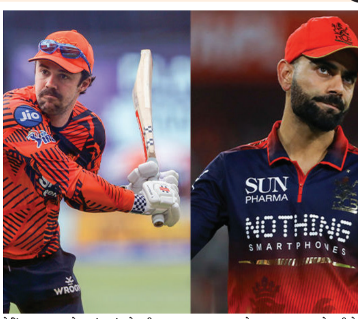
બેટિંગ કરવા માટે કહ્યું હતું. હેડની આ વાત પર વળતો જવાબ આપતા કોહલીએ

IPL 2026માં 22 મેના શુક્રવારે સનરાઈઝર્સ હૈદરાબાદ (SRH) અને રોયલ ચેલેન્જર્સ બેંગલુરુ (RCB) વચ્ચે એક હાર્દવોલ્ટેજ મેચ રમાઈ હતી. આ રોમાંચક મુકાબલામાં માત્ર યોગ્ગા-છગ્ગાનો જ વરસાદ નહોતો થયો, પરંતુ મેદાન પર ભારે તણાવ પણ જોવા મળ્યો હતો. મેચ દરમિયાન વિરાટ કોહલી અને ઓસ્ટ્રેલિયન બેટ્સમેન ટ્રેવિસ હેડ વચ્ચે તીખી નોકજોગ થઈ હતી. જેની આડઅસર હવે સોશિયલ મીડિયા પર દેખાઈ રહી છે, જ્યાં ટ્રેવિસ હેડની પત્ની જેસિકા હેડને વિરાટ કોહલીના કેન્સની અભદ્ર ટ્રોલિંગનો સામનો કરવો પડી રહ્યો છે. આ મેચમાં RCBની ટીમ 256 રનના વિશાળ ટાર્ગેટનો પીછો કરી રહી હતી અને વિરાટ કોહલી બેટિંગ કરી રહ્યો હતો. આ દરમિયાન હૈદરાબાદના ફિલ્ડર ટ્રેવિસ હેડે કોહલીને વધુ આક્રમક બેટિંગ કરવા માટે કહ્યું હતું. હેડની આ વાત પર વળતો જવાબ આપતા કોહલીએ