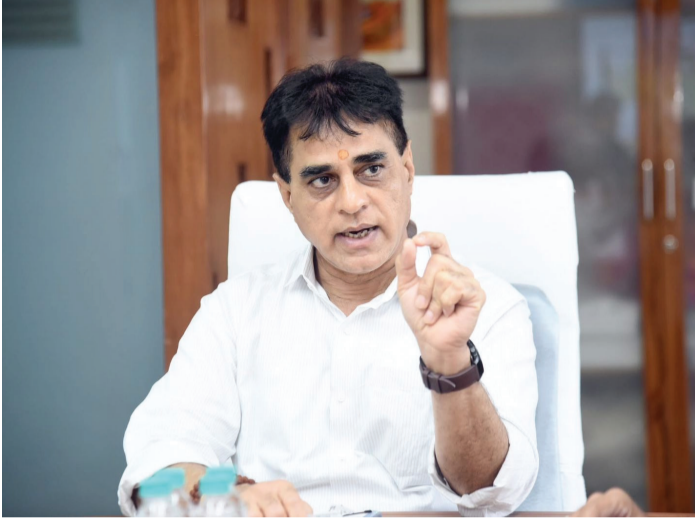
વિમાન દુર્ઘટનાના વળતર પેટે ટાટા એરલાઈન્સ આરોગ્ય વિભાગને રૂ. 53.12 કરોડ ચૂકવશે

અમદાવાદના અસારવા સિવિલ હોસ્પિટલ નજીક આવેલા ન્યૂ મેન્ટલ કેમ્પસના આધુનિકીકરણ માટે રાજ્ય સરકારે એક મોટો નિર્ણય લીધો છે. કેમ્પસમાં રૂ. 105 કરોડના ખર્ચે અત્યાધુનિક સુપર સ્પેશિયાલિટી હોસ્પિટલ, કેન્ટીન બ્લોક અને નવા સબ-સ્ટેશનનું નિર્માણ કરવામાં આવશે. આરોગ્ય ક્ષેત્રના ઈન્ફ્રાસ્ટ્રક્ચરને વધુ મજબૂત કરવા માટે રાજ્ય સરકાર સંપૂર્ણ કટિબદ્ધતા સાથે આગળ વધી રહી છે.