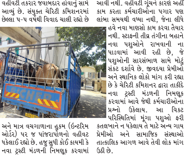
અને માત્ર વચગાળાના હુકમ (ઈન્ટરિમ ઓર્ડર) પર જ પાંજરાપોળનો વહીવટ ધકેલાઈ રહ્યો છે. હજુ સુધી કોઈ કાયમી કે નવા ટ્રસ્ટી મંડળની નિમણૂક કરવામાં

ડભોઈના ઐતિહાસિક અને સૌથી મોટી સાર્વજનિક પાંજરાપોળનો વહીવટ છેલ્લા કેટલાક સમયથી અત્યંત કથળેલી સ્થિતિમાં પહોંચી ગયો છે. તાજેતરમાં જ ભરૂચ જિલ્લામાંથી જીવદયા પ્રેમીઓ કતલખાને જતા ૧૫ જેટલા મૂંગા પશુઓને આબાદ બચાવીને, ૬૦ કિલોમીટર દૂર ડભોઈ પાંજરાપોળ ખાતે લાવ્યા હતા. પરંતુ, પાંજરાપોળના સત્તાધીશો દ્વારા આ પશુઓ સ્વીકારવાનો સ્પષ્ટ ઈનકાર કરી દેવામાં આવતા જીવદયા પ્રેમીઓમાં ભારે નારાજગી અને આકોશ ફાટી નીકળ્યો છે. કતલખાનેથી મહામુશ્કેલીએ બચેલા આ મૂંગા પશુઓને હવે ક્યાં ધકેલાઈ રહ્યો છે. હજુ સુધી કોઈ કાયમી કે નવા ટ્રસ્ટી મંડળની નિમણૂક કરવામાં