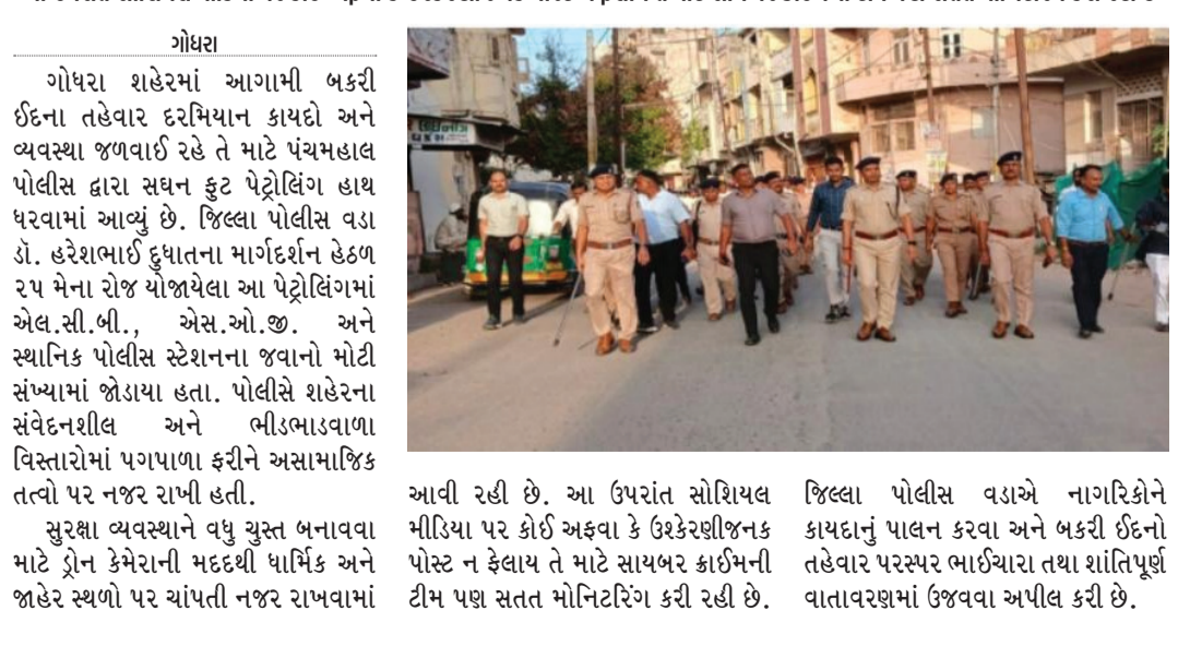
આવી રહી છે. આ ઉપરાંત સોશિયલ મીડિયા પર કોઈ અફવા કે ઉદ્દેશીજનક પોસ્ટ ન ફેલાય તે માટે સાયબર ક્રાઈમની ટીમ પણ સતત મોનિટરિંગ કરી રહી છે. જિલ્લા પોલીસ વડાએ નાગરિકોને કાયદાનું પાલન કરવા અને બકરી ઇંદનો તહેવાર પરસ્પર ભાઈચારા તથા માંતિપૂર્ણ વાતાવરણમાં ઉજવવા અપીલ કરી છે.

આ ઉપરાંત સોશિયલ મીડિયા પર કોઈ અફવા કે ઉદ્દેશીજનક પોસ્ટ ન ફેલાય તે માટે સાયબર ક્રાઈમની ટીમ પણ સતત મોનિટરિંગ કરી રહી છે