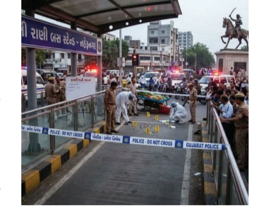
ઉદ્ધરાટમાં આવીને નિવૃત્ત DySPએ પોતાની લાયસન્સ વાળી રિવોલ્વર કાઢીને હવામાં અને સામેના પક્ષ તરફ ધડાધડ રાઉન્ડ ફાયરિંગ શરૂ કરી દીધું હતું. ફાયરિંગના અવાજથી આજુબાજુનો વિસ્તાર ધક્કાધક્કા ઊભો હતો અને લોકોમાં ભારે નાસભાગ મચી ગઈ હતી. ઘટનાના મુખ્ય અંશો:

ધારણ કર્યું હતું. બંને પક્ષો સામસામે આવી જતાં મામલો બિચક્યો હતો અને ભારે બોલાચાલી થઈ હતી.