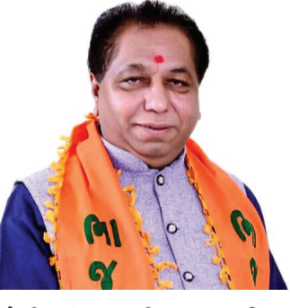
પહેલી પસંદ ગણાતી દમદાર 'મહિન્દ્રા થાર' ગાંધી પછ ત્રીજા ક્રમના કાફલાની શાન વધારે છે. સુરક્ષા માટે રિવોલ્વર: પોતાના ખાનગી હથિયારોમાં તેઓ એક અત્યાધુનિક રિવોલ્વર પણ ધરાવે છે. પસંદગી પાછળની 'ઈન્સાઈડ સ્ટોરી': વગ અને વફાદારીનો ખેલાયો ખેલ આ આખી વરણી પાછળ ભાજપના મોવડીમંડળની એક ચોક્કસ અને

અમદાવાદ મ્યુનિસિપલ કોર્પોરેશન (AMC)ના નવા પદાધિકારીઓની વરણી કરતા જ સત્તાના ગલિયારાઓમાં ભારે ગરમાવો આવી ગયો છે. આ વખતે અમદાવાદને એવા મેયર મળ્યા છે જેમની સંપત્તિના આંકડા સાંભળીને ભલભલાની ઓંખો પહોળી થઈ જાય તેમ છે. નવા મેયર માત્ર રાજકીય રીતે જ નહીં, પણ આર્થિક રીતે પણ સુપર પાવરફુલ છે. તેમની પાસે ૧૧૦ કરોડ રૂપિયા કરતાં વધુની અટક સંપત્તિ હોવાનું સામે આવ્યું છે, જેના કારણે તેઓ અત્યાર સુધીના સૌથી ધનાઢ્ય મેયરોની યાદીમાં મોખરે આવી ગયા છે. જમીનનો મોટો કારોબાર: નવા મેયર સાહેબ માત્ર શહેરમાં જ નહીં, પણ અલગ-અલગ ૮૮ જેટલી જગ્યાઓ પર કિંમતી જમીનો અને પ્રોપર્ટી ધરાવે છે. સોના અને ગાંધીના શોખીન: તેમની પાસે અંદાજે ૫૭ તોલા જેટલું કિંમતી સોનું છે. આ સિવાય યુવાનોની