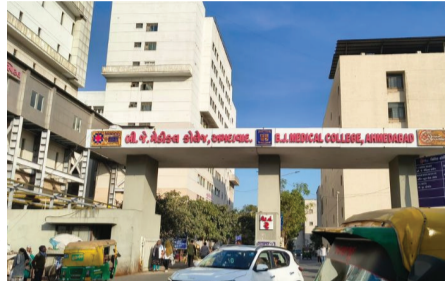
પી.જી. ડોક્ટર્સ માટે રહેવાની સુવિધા મેડિકલ ક્ષેત્રે સુપર સ્પેશિયાલિટીની નવીન ૪૮ બેડકોનો વધારો થયો છે. તેને ધ્યાનમાં રાખીને આગામી આયોજન ઘડવામાં આવ્યું છે. આગામી ત્રણ વર્ષના કુલ ૧૪૪ વિદ્યાર્થીઓ સહિત કુલ ૨૩૬

ટાટા એરલાઈન્સે આ મામલે સકારાત્મક અભિગમ દાખવ્યો છે અને આ પૂરેપૂરી રકમ આગામી સમયમાં આરોગ્ય વિભાગને ચૂકવી દેવાની ખાતરી આપી છે. રૂ. 53.12 કરોડ સુપર સ્પેશિયાલિટી મેરીડ પી.જી. ડોક્ટર્સ માટે રહેવાની સુવિધા મેડિકલ ક્ષેત્રે સુપર સ્પેશિયાલિટીની નવીન ૪૮ બેડકોનો વધારો થયો છે. તેને ધ્યાનમાં રાખીને આગામી આયોજન ઘડવામાં આવ્યું છે. આગામી ત્રણ વર્ષના કુલ ૧૪૪ વિદ્યાર્થીઓ સહિત કુલ ૨૩૬