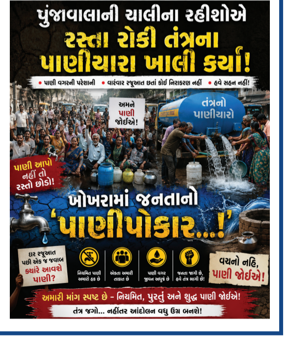
પુંજાવાલાની ચાલીના રહીશોએ રસ્તા રોકી તંત્રના પાણિયારા ખાલી કર્યા! આમને પાણી જોઈએ! તંત્ર જગો... નહીંર આંદોલન વધુ ઉગ્ર બનશે!

આપના વિસ્તારની સમસ્યાઓ, ગેરકાયદે પ્રવૃત્તિઓ, ભ્રષ્ટાચાર અંગેની માહિતી, આપના વિસ્તારના સમાચાર, ફોટા, સામાજિક, ધાર્મિક પ્રવૃત્તિઓના અહેવાલ માટે સંપર્ક કરો : 9662420070