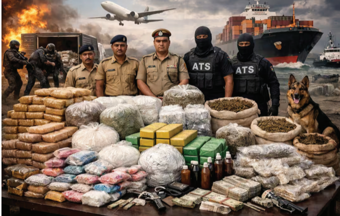
'યુરોપ' નામના એક મોટા કાર્ગો વહાણમાં બ્રાઝિલથી ગેરકાયદેસર રીતે નશીલા પદાર્થો લાવવામાં આવી રહ્યા છે. આ ચોક્કસ ઈનપુટ્સના આધારે

ગુજરાતનો દરિયા કિનારો ફરી એકવાર ડ્રગ્સ માહિયાઓ માટે કાળ સાબિત થયો છે. ગુજરાત એન્ટી ટેરરિસ્ટ સ્કવોડ (ATS) અને ઈન્ડિયન કોસ્ટ ગાર્ડ (ICG) દ્વારા કચ્છના દરિયામાં એક અત્યંત ગુપ્ત અને સફળ સંયુક્ત ઓપરેશન હાથ ધરીને આંતરરાષ્ટ્રીય ડ્રગ્સ રેકેટનો પર્દાફાશ કરવામાં આવ્યો છે. બ્રાઝિલથી દરિયાઈ માર્ગે ગુજરાત થઈને દિલ્હી સુધી પહોંચાડવામાં આવી રહેલો ૧૫૦ કિલો હાર્ટ-કવોલિટી કોકેઈનનો મસમોટો જથ્થો સુરક્ષા એજન્સીઓએ ઝડપી પાછો કર્યો છે. મળતી વિગતો મુજબ, સુરક્ષા એજન્સીઓને બાતમી મળી હતી કે