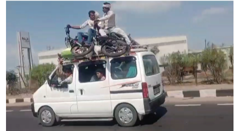
કેદ કરી લીધી હતી, જે હવે વાયુવેગે વાયરલ થઈ રહી છે. હાઈવે પરથી પસાર થતી ભારે માલવાહક ટ્રકો અને સ્પીડમાં જતા અન્ય વાહનો વચ્ચે આ પ્રકારની જોખમી હરકત કોઈપણ મોટી દુર્ઘટનાને ખુલ્લું આમંત્રણ આપી રહી હતી.