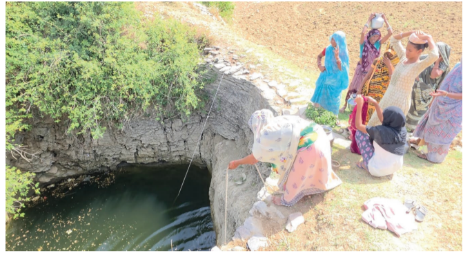
કિલોમીટર સુધી ચાલીને જવું પડે છે. બેડા મૂકી પાણી લાવવાની ફરજ પડતા ડુંગરાળ અને કાચા રસ્તાઓ પરથી માથે

પીવાનું પાણી મેળવવા માટે મહિલાઓ, વૃદ્ધો અને બાળકોને રોજિંદા એકથી બે કિલોમીટર સુધી ચાલીને જવું પડે છે