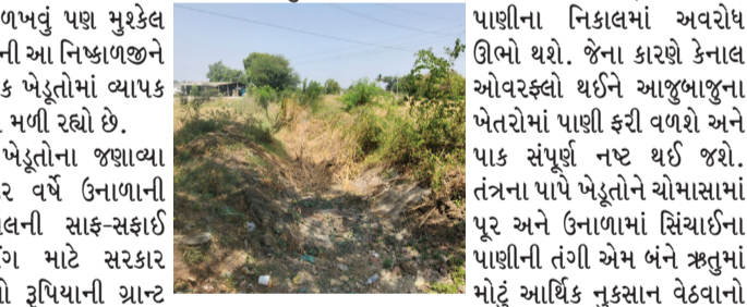
પાણીના નિકાલમાં અવરોધ ઊભો થશે. જેના કારણે કેનાલ ઓવરફ્લો થઈને આજુબાજુના પેટકોમાં પાણી ફરી વળશે અને માટું આર્થિક નષ્ટ થઈ જશે. તંત્રના પાપે ખેડૂતોને યોમાસામાં પૂર અને ઉનાળામાં સિંચાઈના પાણીની તંગી એમ બંને ઋતુમાં મોટું આર્થિક નુકસાન વેઠવાનો વારો આવશે.

ડભોઇ, ક્રમીશ ખત્રી યોમાસાના આગમનને હવે ગણતરીના દિવસો જ બાકી રહ્યા છે ત્યારે ડભોઈ તાલુકાના પરાસીલી ગામ પાસેથી પસાર થતી વઢવાણા કેનાલના વહીવટી તંત્રની ધોર બેદરકારી સામે આવી છે. કેનાલમાં એટલી હદે કચરો, ઘાસચારો અને ગાંડા બાવળો ઊગી નીકળ્યા છે કે કેનાલનું અસ્તિત્વ ઓળખવું પણ મુશ્કેલ બન્યું છે. તંત્રની આ નિષ્ણાળજીને કારણે સ્થાનિક ખેડૂતોમાં વ્યાપક આકોશ જોવા મળી રહ્યો છે. સ્થાનિક ખેડૂતોના જણાવ્યા અનુસાર, દર વર્ષે ઉનાળાની ઋતુમાં કેનાલની સાફ-સફાઈ અને રિપેરિંગ માટે સરકાર તરફથી લાખો રૂપિયાની ગ્રાન્ટ મંજૂર કરવામાં આવે છે. પરંતુ આ વર્ષે યોમાસું ફૂલકર્ણ નિદ્રામાંથી જાગે અને યોમાસું બેસે તે શરૂ કરવામાં આવ્યું નથી. કેનાલ હાલમાં ઝાંડી-ઝાંખરાથી સંપૂર્ણપણે ઢંકાઈ ગઈ છે. જેને પગલે ખેડૂતો સવાલ ઉઠાવી રહ્યા છે કે ગ્રાન્ટના નાણાં આખરે ગયા ક્યાં? શું સાફ-સફાઈના પૈસા માત્ર કાગળ પર જ બતાવીને ભ્રષ્ટાચાર આચરવામાં આવ્યો છે? યોમાસા આરે હવે માંડ ૨૦ થી ૨૫ દિવસ જેટલો સમય બાકી રહ્યો છે. જો આ ટૂંકા ગાળામાં કેનાલની સફાઈ કરવામાં નહીં આવે, તો વરસાદી પાણીના નિકાલમાં અવરોધ ઊભો થશે. જેના કારણે કેનાલ ઓવરફ્લો થઈને આજુબાજુના પેટકોમાં પાણી ફરી વળશે અને માટું આર્થિક નષ્ટ થઈ જશે. તંત્રના પાપે ખેડૂતોને યોમાસામાં પૂર અને ઉનાળામાં સિંચાઈના પાણીની તંગી એમ બંને ઋતુમાં મોટું આર્થિક નુકસાન વેઠવાનો વારો આવશે. ખેડૂતોની માંગ છે કે અધિકારીઓ ફૂલકર્ણ નિદ્રામાંથી જાગે અને યોમાસું બેસે તે પગલે યુદ્ધના ધોરણે વઢવાણા કેનાલનું સફાઈ કામ શરૂ કરાવે.