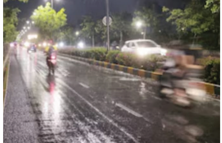
કાલોલ પંથકના વિસ્તારોમાં વરસાદ

મળી છે. છેલ્લા કેટલાક દિવસોથી રાખના અનેક વિસ્તારોમાં તાપમાન સતત ઊંચું રહેતા લોકો ગરમીથી ત્રાહિમામ પોકારી ઊંઘ્યા હતા. ત્યારે રાતના સમયે વરસાદે વાતાવરણમાં ઠંડક પ્રસરી દીધી છે. જ્યાં કાલોલ પંથકના વિસ્તારોમાં વરસાદ વરસાદના કારણે રસ્તાઓ ભીના બન્યા હતા અને ગરમીનો પ્રકોપ ઘટતા લોકોએ રાહતનો શ્વાસ લીધો હતો અને લાંબા સમયથી ગરમીનો સામનો કરી રહેલા લોકોને વરસાદથી રાહત મળી હતી. ખેડૂતોમાં પણ વરસાદને લઈને ખુશીનો માહોલ જોવા મળ્યો હતો જ્યાં કાલોલ શહેર વાતાવરણમાં વાતાવરણ વચ્ચે ઉપરતર તાલુકામાં વરસાદી ઝાપટો પડતાં જ કાળા ઊંઘાં વાળો અને પવન સાથે પડેલા વરસાદે સમગ્ર વિસ્તારમાં વાતાવરણને ખુશનુમા બનાવી દીધું સાથે હવામાનમાં આવેલા આ બદલાવથી લોકોમાં આનંદની લાગણી જોવા મળી હતી. વરસાદને કારણે ગરમીનું પ્રમાણ ઘટ્યું છે અને આગામી દિવસોમાં પણ રાખના કેટલાક વિસ્તારોમાં વરસાદી માહોલ થયાવત રહે તેવી શક્યતા વ્યક્ત કરવામાં આવી રહી છે.