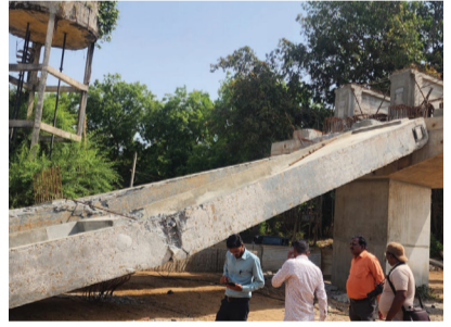
ભવિષ્યમાં આવી ઘટના ફરી ન બને તે માટે જરૂરી પગલાં લેવામાં આવશે. ઘટનાના પગલે આસપાસના વિસ્તારમાં સુરક્ષા વ્યવસ્થા વધુ સઘન બનાવવામાં આવી છે અને બાંધકામની કામગીરી અંગે તહેદદારીના પગલાં હાથ ધરવામાં આવ્યા છે. ભીજ તરફ રેલવે અને સંબંધિત એજન્સીઓ દ્વારા ઘટનાની તપાસ પૂર્ણ થયા બાદ યોગ્ય કાર્યવાહી કરવામાં આવશે તેવી ખાતરી આપવામાં આવી છે.