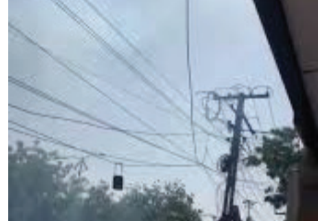
લિમિટેડ (MGVCL) ને જાણ કરતાં અધિકારીઓ અને લાઈનમેનનોનો કાફલો ઘટનાસ્થળે પહોંચ્યો હતો અને