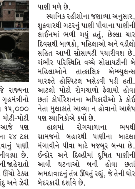
હાઈપ્રોફાઈલ વિસ્તાર છે જે રાજ્યના મુખ્યમંત્રી અને દેશના ગૃહમંત્રીનો મતવિસ્તાર છે. કોર્પોરેશનના ૧૫,૦૦૦ હોસ્પિટલોમાં દાખલ કરવા પડ્યા છે. આ ખાખી ઘટનાને પગલે કોરોનેા શાસક પક્ષ ભાજપ અને એએમસી (AMC) તંત્ર સામે મોરચો ખોલ્યો છે.

અમદાવાદ શહેરના પોશ ગણાતા ઘાટલોડિયા વિધાનસભા વિસ્તાર અને ગોતા વોર્ડમાં આવેલી આકાંબા એપાર્ટમેન્ટમાં પ્રદૂષિત પાણીના કારણે ભયાનક રોગચાળો ફાટી નીકળ્યો છે. મ્યુનિસિપલ કોર્પોરેશનનું પીવાનું પાણી અને ગટરનું પાણી ભેળવણ થવાના કારણે સોસાયટીના ૫૦૦થી વધુ નાગરિકો ઝાડા-ઉલ્ટીની ગંભીર બીમારીનો ભોગ બન્યા છે, જેમાંથી ૩૦૦થી વધુ ગેરકાયદેસરના પાણીના કારણે ભયાનક રોગચાળો ફાટી નીકળ્યો છે. મ્યુનિસિપલ કોર્પોરેશનનું પીવાનું પાણી અને ગટરનું પાણી ભેળવણ થવાના કારણે સોસાયટીના ૫૦૦થી વધુ નાગરિકો ઝાડા-ઉલ્ટીની ગંભીર બીમારીનો ભોગ બન્યા છે, જેમાંથી ૩૦૦થી વધુ ગેરકાયદેસરના પાણીના કારણે ભયાનક રોગચાળો ફાટી નીકળ્યો છે. મ્યુનિસિપલ કોર્પોરેશનનું પીવાનું પાણી અને ગટરનું પાણી ભેળવણ થવાના કારણે સોસાયટીના ૫૦૦થી વધુ નાગરિકો ઝાડા-ઉલ્ટીની ગંભીર બીમારીનો ભોગ બન્યા છે, જેમાંથી ૩૦૦થી વધુ ગેરકાયદેસરના પાણીના કારણે ભયાનક રોગચાળો ફાટી નીકળ્યો છે. મ્યુનિસિપલ કોર્પોરેશનનું પીવાનું પાણી અને ગટરનું પાણી ભેળવણ થવાના કારણે સોસાયટીના ૫૦૦થી વધુ નાગરિકો ઝાડા-ઉલ્ટીની ગંભીર બીમારીનો ભોગ બન્યા છે, જેમાંથી ૩૦૦થી વધુ ગેરકાયદેસરના પાણીના કારણે ભયાનક રોગચાળો ફાટી નીકળ્યો છે. મ્યુનિસિપલ કોર્પોરેશનનું પીવાનું પાણી અને ગટરનું પાણી ભેળવણ થવાના કારણે સોસાયટીના ૫૦૦થી વધુ નાગરિકો ઝાડા-ઉલ્ટીની ગંભીર બીમારીનો ભોગ બન્યા છે, જેમાંથી ૩૦૦થી વધુ ગેરકાયદેસરના પાણીના કારણે ભયાનક રોગચાળો ફાટી નીકળ્યો છે.