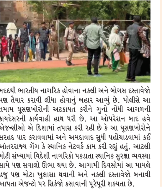
મદદથી ભારતીય નાગરિક હોવાના નકલી અને ભોગસ દસ્તાવેજો પછા તૈયાર કરાવી લીધા હોવાનો અહેવાલ આવ્યો છે. પોલીસે આ તમામ ઘૂસણખોરોની અટકાયત કરીને ગુનો નોંધી આગળની કાયદેસરની કાર્યવાહી હાથ ધરી છે. આ ઓપરેશન બાદ હવે એજન્સીઓ એ દિશામાં તપાસ કરી રહી છે કે આ ઘૂસણખોરોને સરહદ પાર કરાવવામાં અને અમદાવાદ સુધી પહોંચાડવામાં કોઈ અંતરરાજ્ય ગેંગ કે સ્થાનિક નેટવર્ક કામ કરી રહ્યું હતું. આટલી મોટી સંખ્યામાં વિદેશી નાગરિકો પકડાતા સ્થાનિક સુરક્ષા વ્યવસ્થા સાથે પછા સવાલો ઊભા થયા છે. આગામી દિવસોમાં આ મામલે હજુ પછા મોટા પુલાસા થવાની અને નકલી દસ્તાવેજો બનાવી આપતા એજન્સી પર સિકંદરો કસાવાની પૂરેપૂરી શક્યતા છે.

અમદાવાદ ગુજરાત પોલીસ અને કેન્દ્રીય સુરક્ષા એજન્સીઓ દ્વારા રાજ્યભરમાં આરંભેલા ગુપ્ત ઓપરેશનમાં એક બહુ મોટી સફળતા મળી છે. 'ઓપરેશન ડેલ્ટા' (Operation Delta) હેઠળ અમદાવાદ શહેરના વિવિધ વિસ્તારોમાંથી ગેરકાયદેસર રીતે વસવાટ કરતા 166 બાંગ્લાદેશી ઘૂસણખોરોને ઝડપી પાડવામાં આવ્યા છે. આ મેગા ડ્રાઈવના કારણે ગેરકાયદેસર વસવાટ કરતા તત્વો અને તેમના આશ્રયદાતાઓમાં ભારે ફફડાટ વ્યાપી ગયો છે. મળતી વિગતો મુજબ, સુરક્ષા એજન્સીઓને ચોક્કસ ઈન્ટેલિજન્સ મળ્યા હતા કે અમદાવાદના કેટલાંક ચોક્કસ વિસ્તારોમાં મોટી સંખ્યામાં બાંગ્લાદેશી નાગરિકો કોઈપણ માન્ય વિઝા કે પાસપોર્ટ વિના ગેરકાયદેસર રીતે રહી રહ્યા છે. આ ખાતમીના આધારે પોલીસે અલગ-અલગ ટીમો બનાવીને શહેરના શંકાસ્પદ રહેણાંક વિસ્તારો, ઝૂંપણપટ્ટીઓ અને બાંધકામ સાઈટો પર એક્સાઈટ દરોડા પાઘ્યા હતા. આ સર્ચ ઓપરેશન દરમિયાન પ્રાથમિક પુછપરછમાં શંકાસ્પદ જણાતા લોકોના દસ્તાવેજોની ચકાસણી કરતા ઘૂસણખોરીનો આ મોટો ભાંગાડો થયો હતો. પકડાયેલા 166 બાંગ્લાદેશીઓ પાસે ભારતમાં રહેવા માટેના કોઈ કાયદેસરના આધાર-પુરાવા મળી આવ્યા નથી. ચોંકાવનારી બાબત એ છે કે, આમાંથી કેટલાંક લોકોએ સ્થાનિક એજન્સીની