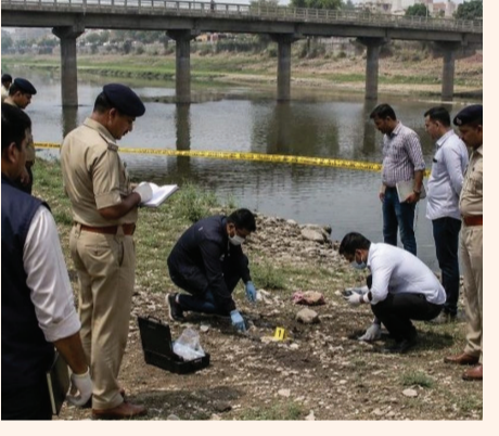
બંધ નહોતી કરી અને સતત ફરીથી જોવાનું ચાલુ રાખ્યું હતું. દરમિયાન, ગત વર્ષે પોલીસના હાથે ઝડપાયેલા એક શંકાસ્પદ છેકેદારની હિસ્તી તપાસતા આ કેસમાં એક

રાજકોટ પોલીસને આઠ વર્ષ જૂના એક ચક્રારી અને રહસ્યમય મર્ડર કેસનો ભેદ ઉકેલવામાં મોટી સફળતા મળી છે. આઠ વર્ષ પહેલાં રાજકોટમાંથી ધડ વગરનું એક બાળકના માથાનું કંકાલ મળી આવ્યું હતું, જે તે સમયે પોલીસ માટે મોટો કોયડો બન્યું હતું. જોકે, આ ગુનાનો ભેદ હવે મહદઅંશે ઉકેલાઈ ગયો છે. પોલીસને શંકા છે કે ગત વર્ષે ઝડપાયેલા એક ફૂર છેકેદારે જ કામ ન કરવા બદલ માસૂમ બાળક પર અમાનુષી અત્યાચાર ગુજારીને તેની નિર્મમ હત્યા કરી નાખી હતી. આઠ વર્ષ પહેલાં મળ્યું હતું ધડ વગરનું માથું આ ઘટનાને લઈને અંધારામાં રહ્યું છે, આશરે આઠ વર્ષ પૂર્વે રાજકોટના એક અવાવડુ વિસ્તારમાંથી માત્ર બાળકના માથાનો ભાગ મળી આવ્યો હતો, જ્યારે તેનું ધડ ગાયબ હતું. લાંબા સમય સુધી તપાસ કરવા છતાં બાળકની ઓળખ કે તેના હત્યારા સુધી પોલીસ પહોંચી શકી નહોતી. પરંતુ રાજકોટ પોલીસે આ કેસની ફાઈલ