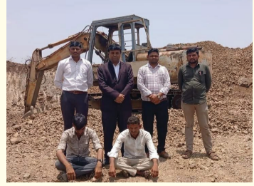
ચોટીલા ચોટીલા પંથકમાં સરકારી જમીનો પર ગેરકાયદેસર ખનન કરતા માફિયાઓ સામે વહીવટી તંત્ર દ્વારા લાલ આંખ કરવામાં આવી છે.