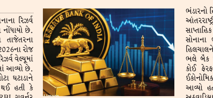
આધારલઈ છે. સેન્ટ્રલ બેંકનું ગોલ્ડ રિઝર્વ યથાવત છે, એટલું જ નહીં, તેમાં થોડો વધારો પણ થયો છે.' રિઝર્વ બેંકે વિગતવાર સ્પષ્ટતા કરી છે કે સોનાના ભંડારના મૂલ્યમાં આ ઘટાડો સોનાના વેચાણને કારણે નહીં, પરંતુ ઈન્ટરનેશનલ માર્કેટમાં કિંમતોમાં થતો ફેરફાર (વેલ્યુએશન લોસ)ના કારણે થયો છે. સોનાના

વોશિંગ્ટન ભારતીય રિઝર્વ બેંક (RBI)ના સોનાના રિઝર્વ વેલ્યુમાં 2 અબજ ડૉલરથી વધુનો ઘટાડો નોંધાયો છે. RBI દ્વારા જાહેર કરવામાં આવેલા તાજેતરના સાપ્તાહિક રિપોર્ટ અનુસાર, 29મી મે, 2026ના રોજ પૂરા થયેલા સપ્તાહ દરમિયાન સોનાના રિઝર્વ વેલ્યુમાં 2.19 અબજ ડૉલરનો ઘટાડો દર્શાવવામાં આવ્યો છે. ગોલ્ડ રિઝર્વના વેલ્યુમાં થયેલા આ મોટા ઘટાડાને પગલે બજારમાં એવી અટકળો શરૂ થઈ હતી કે મધ્યસ્થ બેંકે સોનું વેચ્યું હશે, પરંતુ RBI ગવર્નર સંજય મલ્હોત્રાએ આ તમામ અટકળોને નકારી કાઢી છે. સોનું વેચ્યું નથી, ભંડારમાં ઉલટો વધારો થયો છે: ગવર્નર અહેવાલો અનુસાર, શુક્રવારે (પાંચમી જૂન) નાણાકીય નીતિની જાહેરાત બાદ યોજાયેલી પત્રકાર પરિષદમાં ગવર્નર સંજય મલ્હોત્રાએ સ્પષ્ટતા કરતાં જણાવ્યું હતું કે, 'RBIએ સોનું વેચ્યું હોવાના અહેવાલો