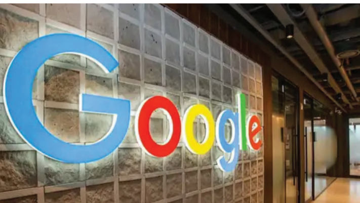
કેપેબિલિટી સેન્ટર (GCC) માટે ગુરુગ્રામના DLF સાયબર સિટીમાં 46,437 સ્ક્વેર ફીટ ઓફિસ સ્પેસ 5 વર્ષે માટે લીઝ પર લીધી છે. એરબીએનબી આ માટે લગભગ 61.53 લાખ રૂપિયાનું પ્રારંભિક માસિક ભાડું ચૂકવી રહી છે. માર્કેટ એક્સપર્ટ્સનું માનવું છે કે ટેકનોલોજી સેક્ટરની ડિગ્રાઉન્ડ કંપનીઓ હવે 130 પ્રતિ સ્ક્વેર ફીટથી વધુના દરે લોન્ગ-ટર્મ અને હાઈ-વેલ્યુ લીઝ એગ્રીમેન્ટ સાઈન કરી રહી છે. આ એ વાતનો સ્પષ્ટ સંકેત છે કે દેશમાં ગ્રેડ A કોમર્શિયલ ઈન્ફ્રાસ્ટ્રક્ચરની માંગ ખૂબ જ મજબૂત બની રહી છે. ગ્લોબલ કેપિટલિટી સેન્ટર્સનો દબદબો યથાવત ભારતના ઓફિસ લીઝ માર્કેટને આગળ વધારવામાં ગ્લોબલ કેપિટલિટી સેન્ટર્સ (GCCs)ની સૌથી મોટી ભૂમિકા છે. જાન્યુઆરીથી માર્ચ 2026ના ક્વાર્ટર દરમિયાન ભારતમાં કુલ 20.7 મિલિયન સ્ક્વેર ફીટ (msf) ઓફિસ સ્પેસ લીઝ પર લેવામાં આવી. તેમાંથી એકલા GCCનો હિસ્સો 9.1 મિલિયન સ્ક્વેર ફીટ રહ્યો, જે કુલ એક્સપોર્શનનો 44% હિસ્સો છે.

ત્રણ વર્ષે ભાડામાં 15%નો વધારો કરવાનો નિયમ પણ સામેલ છે. આ નવી લીઝ 1 ઓક્ટોબર 2025થી શરૂ થઈ ગઈ છે, જે કોમર્શિયલ ટાવરના બીજા માળથી લઈને 16મા માળ નહીં, વર્ષ 2025માં જ ગૂગલે ઈસ્ટ બેંગલુરુના શેડદાનેકુંડીમાં પોતાની લગભગ 8,70,000 સ્ક્વેર ફીટની ઓફિસ સ્પેસની લીઝને રિન્યૂ પણ કરી હતી, જેના માટે કંપની વાર્ષિક 90