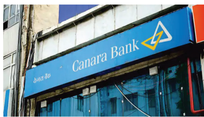
ખાતાઓના સંચાલન સાથે સંબંધિત છે. RBIની માર્ગદર્શિકા જણાવે છે કે જો કોઈ ખાતામાં છેલ્લા એક વર્ષમાં ગ્રાહક દ્વારા કોઈ વ્યવહાર થયો હોય, તો તેને સક્રિય ગણવામાં આવશે. જોકે, કેનેરા બેંકે એવા

મુંબઈ ભારતીય રિઝર્વ બેંક (RBI)એ કેનેરા બેંક પર 41.8 લાખ રૂપિયાનો દંડ ફટકાર્યો છે. આ કાર્યવાહીનો યોર કસ્ટમર (KYC) નિયમો સહિત કેટલીક જરૂરી બેંકિંગ માર્ગદર્શિકાઓનું પાલન ન કરવા બદલ કરવામાં આવી છે. RBIની તપાસમાં સામે આવ્યું છે કે કેનેરા બેંકે ઘણા ગ્રાહકોના KYC રેકોર્ડ્સને નિર્ધારિત સમયમર્યાદામાં સેન્ટ્રલ KYC રેકોર્ડ્સ રજિસ્ટ્રી (CKYCR) પર અપલોડ કર્યા ન હતા. નિયમો અનુસાર, તમામ બેંકોએ નવા અને હાલના ગ્રાહકોને KYC ડેટા આ કેન્દ્રીય રજિસ્ટ્રી પર નિર્ધારિત સમયની અંદર અપડેટ કરવો પડે છે, જેથી ઇલેક્ટ્રોનિક્સ રોકી શકાય. કેનેરા બેંક આ સમયરેખાનું પાલન કરવામાં નિષ્ફળ રહી. નિયમોના ઉલ્લંઘનનો બીજો કિસ્સો ગ્રાહક