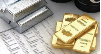
કિંમતમાં તેજ જોવા મળી છે. 2026માં અત્યાર સુધી સોનું 21 હજાર રૂપિયા અને ચાંદી 27 હજાર રૂપિયા મોંઘી થઈ છે. 31 ડિસેમ્બર 2025ના રોજ 10 ગ્રામ સોનું એટલે કે તેની કિંમત 6,442 રૂપિયા હતી. આ વર્ષે સોના-ચાંદીની

મુંબઈ સોના-ચાંદીના ભાવમાં આ અઠવાડિયે ઘટાડો જોવા મળ્યો. ઈન્ડિયા બુલિયન એન્ડ જ્વેલર્સ એસોસિએશન (IBJA) અનુસાર, 10 ગ્રામ 24 કેરેટ સોનાનો ભાવ 2,225 રૂપિયા થઈને 1,54 લાખ રૂપિયા થયો છે. આ પહેલા તે ગયા અઠવાડિયે એટલે કે 30 મેના રોજ 1.56 લાખ રૂપિયા પર હતો. જ્યારે, ચાંદી 2.67 લાખ રૂપિયા પ્રતિ કિલોથી ઘટીને 2.53 લાખ રૂપિયા પર આવી ગઈ છે. 2.53 લાખ રૂપિયા પર હતું, જે હવે 1.33 લાખ રૂપિયા પર હતું, જે હવે 1.56 લાખ રૂપિયા પર પહોંચી ગયું છે.