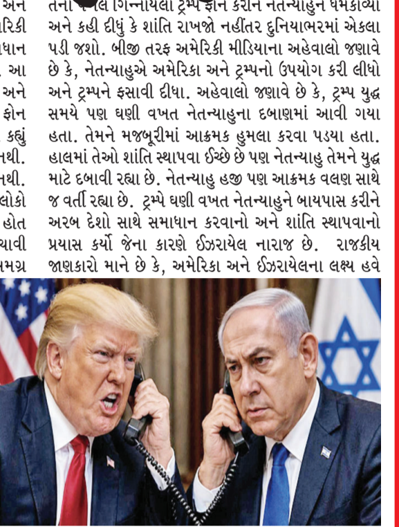
અલગ અલગ થઈ ગયા છે. યુદ્ધમાં અબજો ડોલરનું આંધણ થયા બાદ અમેરિકા હવે ફિક્કસમાં મુકાયું છે. પાસ કરીને ટ્રમ્પ હવે આ યુદ્ધ અટકાવવા અને શાંતિ સ્થાપવા માગે છે. બીજી તરફ ઇઝરાયેલ અને નેતન્યાહુ ઇરાન અને તેના માટે પ્રોક્સિવાર કરતા હિઝબુલ્લાનો જડમૂળથી સફાયો ઈચ્છે છે. જાણકારો એવો પણ દાવો કરે છે કે, અમેરિકા ક્યારેય ઇરાન ઉપર સીધો હુમલો કરવા કે યુદ્ધ કરવાની તરફેણમાં નહોતું. ટ્રમ્પને નેતન્યાહુ દ્વારા દબાણ કરવામાં આવ્યું અને તેઓ યુદ્ધમાં જોડાયા હતા. નેતન્યાહુના લીધે અમેરિકાને યુદ્ધમાં ઉતરવું પડ્યું. હવે અમેરિકા ડીલ કરવા માગે છે પણ ઇઝરાયેલને આ બાબતની કોઈ ચિંતા જ નથી. તે પોતાની રીતે હુમલા કર્યા કરે છે. તેના લીધે હવે આ દોસ્તીના કિલ્લાના કાંચરા ખરવા લાગ્યા છે. ચર્ચા એવી પણ છે કે, અમેરિકાને યુદ્ધ રોકવામાં, હોર્નુઝની ખાડી ખોલવામાં કે પછી ઇરાનને ડીલ કરીને દબાવવાના કામમાં ઇઝરાયેલ દ્વારા કોઈ મદદ કરવામાં આવતી નથી. નેતન્યાહુનો કોઈ સાથ મળતો ન હોવાથી ટ્રમ્પ ગિન્નાયા છે. ટ્રમ્પ ઈચ્છે છે કે, હવે કોઈપણ રીતે કૂટનીતિક સમાધાન આવવું જોઈએ જ્યારે નેતન્યાહુ માને છે કે, ઇરાન ઉપર ફરીથી હુમલા કરવા જોઈએ અને તેને ઘસ્ટ કરી દેવું જોઈએ. તેના કારણે જ ટ્રમ્પ હવે નેતન્યાહુને વિશ્વાસપાત્ર નહીં હોવાના મેણા મારી રહ્યા છે. તે ઉપરાંત તેને ઉપકારો ભુલી જનારા પણ કહી રહ્યા છે. આ પહેલી વખત નથી થયું.