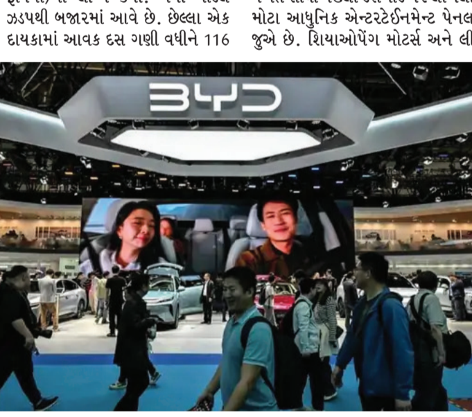
રૂપિયા)માં લોન્ચ કર્યા. નવા મોડેલ ઝડપથી બજારમાં આવે છે. છેલ્લા એક દાયકામાં આવક દસ ગણી વધીને 116 વખતે સૌથી પહેલા ડેશબોર્ડ પર લાગેલા મોટા આધુનિક એન્ટરટેઇનમેન્ટ પેનલ જુએ છે. શિયાઓપેંગ મોટર્સ અને લી

મુંબઈ ચીનના શેનઝેનમાં EV દિગ્ગજ BYDનું હેડક્વાર્ટર છે. અહીં આવતા મહેમાનોને એક પ્રદર્શન જોવા મળતું હતું. એક ટ્રિલથી સામાન્ય EVને વીધવામાં આવતી હતી, જે તરત જ આગ પકડી લેતી. પછી BYDની બ્લેડ બેટરી પર તેનું પુનરાવર્તન કરવામાં આવતું, પરંતુ તે સુરક્ષિત રહેતી. આ જ બેટરીના જોરે BYD EV શિખર પર પહોંચી. પરંતુ હવે ચાર વર્ષમાં પહેલીવાર કંપનીનો નફો ઘટ્યો. સતત આઠ મહિના સુધી વર્ષ-દર-વર્ષ વેચાણમાં ઘટાડો થયો અને 2026ની શરૂઆતમાં હરીફ ગીલીએ ત્રણ વર્ષથી વધુ સમય પછી BYDને ચીનની ટોચની EV કંપનીના પદ પરથી હટાવી દીધી, જોકે બાદમાં BYDએ આ ખિતાબ ફરીથી ઈનવી લીધો. BYDના સ્થાપક વાંગ ચુઆનફુંએ એક એવી રણનીતિ અપનાવી જે તેમને બાકીના લોકોથી અલગ પાડતી હતી - લિથિયમ પ્રોસેસિંગ પ્લાન્ટથી લઈને AI મોડેલ સુધી બધું જ જાતે બનાવો. આ રણનીતિએ અર્થને નિર્ધારિત કરવામાં મદદ કરી. સીલ્ડ જેવા મોડેલ માત્ર 10,000 ડોલર (લગભગ 9.5 લાખ