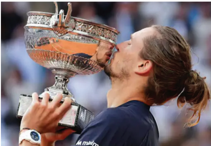
લીધો. આ પછી કોબોલીએ વાપસી કરી અને બીજો સેટ 6-4થી પોતાના નામે કર્યો. ઝવેરેવે ફરી ત્રીજો સેટ 6-4થી જીત્યો, પરંતુ કોબોલીએ ચોથા સેટને ટાઈ-બ્રેકમાં 7-6(5)થી જીતીને મુકાબલાને પાંચમા સેટમાં પહોંચાડી દીધો. છેલ્લા સેટમાં ઝવેરેવે ફરી એકવાર જીત્યો, પરંતુ કોબોલીએ ચોથા સેટને

પેરિસ જર્મનીના એલેક્ઝાન્ડર ઝવેરેવે પોતાની કારકિર્દીનો પહેલો ગ્રાન્ડ સ્લેમ ખિતાબ જીતી લીધો છે. તેણે ફ્રેન્ચ ઓપન 2026ની ફાઇનલમાં ઇટાલીના ફ્લેવિયો કોબોલીને હરાવ્યો. પેરિસમાં રવિવારે રમાયેલી મેન્સ સિંગલ્સ ફાઇનલમાં બીજા સીડ ઝવેરેવે દસમી વરિયતા પ્રાપ્ત ફ્લેવિયોને પાંચ સેટમાં 6-1, 4-6, 6-4, 6-7, 6-1 થી હરાવ્યો. 29 વર્ષના ઝવેરેવે 11 વર્ષથી ગ્રાન્ડ સ્લેમ ટુર્નામેન્ટમાં રમી રહ્યો છે. આ પહેલા તેઓ ગ્રાન્ડ સ્લેમમાં ત્રણ વખત ફાઇનલમાં અને સાત વખત સેમિફાઇનલમાં હારી ચૂક્યો હતો. ફ્રેન્ચ ઓપન ઉપરાંત, ઓસ્ટ્રેલિયન ઓપન, વિમ્બલ્ડન અને યુએસ ઓપનને ગ્રાન્ડ સ્લેમ ટુર્નામેન્ટ કહેવામાં આવે છે. ઝવેરેવે મેચની શરૂઆત ધમાકેદાર અંદાજમાં કરતા પહેલા સેટ સરતાથી 6-1થી જીતી