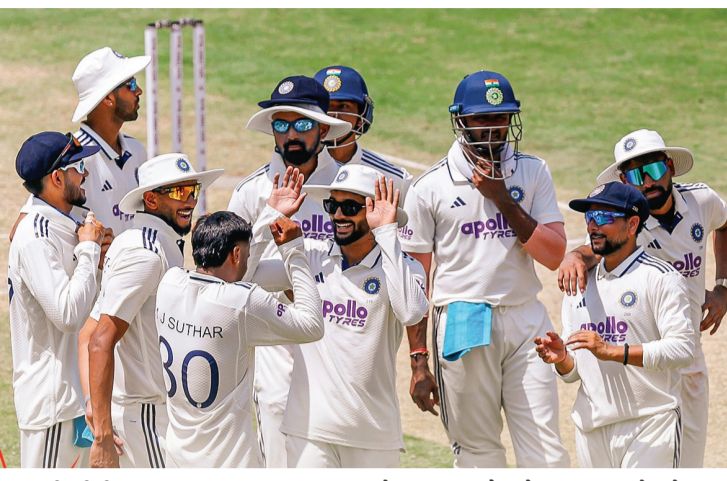
૩૦મી લીધી. ૩. રોકેટ આર્મ ફિલ્ડિંગ: આધુનિક ક્રિકેટમાં ફિલ્ડિંગનું ભદ્ર મહત્વ છે. જાડેજા વિશ્વનો સર્વશ્રેષ્ઠ ફિલ્ડર ગણાય છે. આ નવો ખેલાડી પણ

૧. ડાબોડી સ્પિનર અને આક્રમક બેટિંગનું ધાતક કોમ્બિનેશન: રવીન્દ્ર જાડેજાની જેમ જ આ યુવા ખેલાડી પણ ડાબોડી સ્પિન બોલર છે અને લોઅર-ઓર્ડરમાં આવીને મેચનું પાસુ પલટી નાખે તેવી આક્રમક બેટિંગ કરવાની ક્ષમતા ધરાવે છે. ડેબ્યુ મેચમાં તેણે દબાણની સ્થિતિમાં અદ્ભુત બેટિંગ કરી ટીમનો સ્કોર મજબૂત કર્યો હતો. ૨. સચોટ લાઈન-લેન્થ અને વિકેટ ટેકિંગ ક્ષમતા: જાડેજાની સૌથી મોટી તાકાત એ છે કે તે બેટ્સમેનને રમવાનો બિલકુલ સમય નથી આપતો. આ ડેબ્યુટને ખેલાડીએ પણ અફઘાનિસ્તાન સામે બિલકુલ એ જ અંદાજમાં સચોટ લાઈન અને લેન્થ પર બોલિંગ કરીને બેટ્સમેનોને રન બનાવવા માટે તરસાવી દીધા અને ટપોટપ વિકેટો