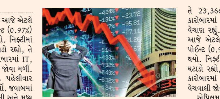
જતી નથી. અહીં ખરીદીની તક હોઈ શકે છે. રેજિસ્ટ્રેશન એટલે કે, તે સ્તર જ્યાં શેર કે ઈન્ડેક્સને ઉપર જવામાં અવરોધ આવે છે. આતું વેચાણ વધવાથી થાય છે. રેજિસ્ટ્રેશન ઝોન પાર કરવા પર તેજની અપેક્ષા રહે છે. 5 જૂને સેન્સેક્સ 116 અંકના ઘટાડા સાથે 74,243 પર બંધ થયો. નિફ્ટીમાં પણ 50 અંકનો ઘટાડો રહ્યો,

બોમ્બે મિડલ ઈસ્ટમાં વધતા તણાવને કારણે આજે એટલે કે સોમવાર, 8 જૂને સેન્સેક્સ 719 પોઈન્ટ (0.97%) ના ઘટાડા સાથે 73,524 પર બંધ થયો. નિફ્ટીમાં પણ 244 પોઈન્ટ્સ (1.04%) નો ઘટાડો રહ્યો, તે 23,123 પર બંધ થયો. આજના કારોબારમાં IT, મેટલ અને રિયલ્ટી શેરોમાં વધુ વેચવાલી જોવા મળી. એપ્રિલમાં થયેલા યુદ્ધવિરામ બાદ પહેલીવાર ઈરાને ઈઝરાયલ પર મિસાઈલ હુમલો કર્યો. જવાબમાં ઈઝરાયલે સોમવારે વહેલી સવારે પશ્ચિમી અને મધ્ય ઈરાનના સૈન્ય ઠેકાણાઓ પર હુમલા કર્યા. તેહરાન, તબરીજ અને ઈસ્ફહાનમાં ધમાકાના સમાચાર છે. આ કારણે ભોગોલિક રાજકીય તણાવ વધી ગયો છે જેની તરત અજાણ પર દેખાઈ રહી છે. સપોર્ટ એટલે, તે સ્તર જ્યાં શેર અથવા ઈન્ડેક્સને નીચે પડવાથી ટેકો મળે છે. અહીં ખરીદી વધવાથી કિંમત સરળતાથી નીચે