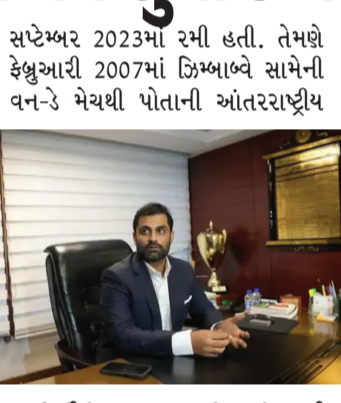
સપ્ટેમ્બર 2023માં રમી હતી. તેમણે ફેબ્રુઆરી 2007માં ઝિમ્બાબ્વે સામેની વન-ડે મેચથી પોતાની આંતરરાષ્ટ્રીય આવી હતી. આ પહેલા સરકારે એક તપાસ સમિતિના રિપોર્ટના આધારે અમીનુલ ઈસ્લામના નેતૃત્વ હેઠળની અગાઉની ચૂંટાયેલી સંસ્થાને ભંગ કરી દીધી હતી. તપાસ સમિતિએ અમીનુલ અને તેમના બોર્ડ સભ્યોને ભ્રષ્ટાચારમાં સામેલા હોવાનું શોધી કાઢ્યું હતું અને બંધારણમાં સુધારાની ભલામણ કરી હતી. ફલીમ સિંહા બન્યા ઉપાધ્યક્ષ, 25 સભ્યોના બોર્ડની રચના પૂર્ણ ચૂંટણી પછી યોજાયેલી પ્રથમ બોર્ડ બેઠકમાં ફલીમ સિંહાને ઉપાધ્યક્ષ તરીકે નિયુક્ત કરવામાં આવ્યા. તેમને 66 મત મળ્યા હતા. આ સાથે 25 સભ્યોના બોર્ડની રચના પૂર્ણ થઈ ગઈ, જે આગામી ચાર વર્ષ સુધી બાંગ્લાદેશ ક્રિકેટનું સંચાલન કરશે.

મુંબઈ બાંગ્લાદેશના પૂર્વ કેપ્ટન તમીમ ઇકબાલને બાંગ્લાદેશ ક્રિકેટ બોર્ડ (BCB)ના નવા અધ્યક્ષ તરીકે ચૂંટવામાં આવ્યા છે. રવિવારે ઢાકામાં યોજાયેલી ચૂંટણીમાં તેઓ બિનહરીફ ચૂંટાયા અને હવે ચાર વર્ષ સુધી આ પદ પર રહેશે. 37 વર્ષીય તમીમ એપ્રિલથી વચગાળાના અધ્યક્ષ તરીકે કામ કરી રહ્યા હતા, જ્યારે બાંગ્લાદેશ સરકારે BCBના નિર્દેશક મંત્રણે બંગ કરી દીધું હતું. તેઓ BCBના 21મા અધ્યક્ષ બન્યા છે. તમીમે ગયા વર્ષે જાન્યુઆરીમાં આંતરરાષ્ટ્રીય ક્રિકેટમાંથી નિવૃત્તિ લીધી હતી. તેમણે બાંગ્લાદેશ માટે પોતાની છેલ્લી મેચ