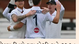
છેલ્લા દિવસે ગેસ એટકિન્સને 30 રન આપીને 5 વિકેટ ઝડપી અને ન્યૂઝીલેન્ડની ઇનિંગ્સ સમેટી લીધી. રોબિન્સને 2, જોશ ટંગે 2 અને કેપ્ટન બેન સ્ટોક્સે 1 વિકેટ લીધી. 167 ઓવરમાં સમાપ્ત થઈ ગઈ, 254 રનને ચેજ કરવા ઉતરેલી ન્યૂઝીલેન્ડની શરૂઆત ખરાબ રહી. કેપ્ટન ટોમ લેથમ ખાતું ખોલા વિના આઉટ થયો, જ્યારે કેન વિલિયમ્સન માત્ર 18 રન

મુંબઈ ઇંગ્લેન્ડે લોર્ડ્સમાં રમાયેલી પ્રથમ ટેસ્ટમાં ન્યૂઝીલેન્ડને 115 રનથી હરાવ્યું. આ સાથે ટીમે ત્રણ મેચની સિરીઝમાં 1-0ની લીડ મેળવી લીધી. બીજા ટેસ્ટ 17 જુનથી ૫ ઓવલ ખાતે રમાશે. રવિવારે ન્યૂઝીલેન્ડ 138 રનમાં ઓલઆઉટ થઈ ગયું. ઇંગ્લેન્ડે 254 રનનો ટાર્ગેટ આપ્યો હતો. મેચના ચોથા દિવસે ગેસ એટકિન્સને બીજા ઇનિંગ્સમાં 5 વિકેટ લીધી. તેણે પહેલી ઇનિંગ્સમાં 2 વિકેટ લીધી હતી. ઓલી રોબિન્સનને મેચમાં 7 વિકેટ લેવા બદલ પ્લેયર ઓફ ધ મેચ તરીકે પસંદ કર્યો. એટકિન્સને 5 વિકેટ મેચના