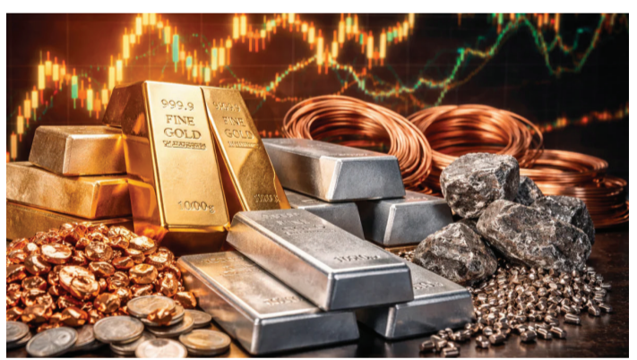
જોવા મળી રહ્યો છે. 31 ડિસેમ્બર 2025 ના રોજ સોનાના ભાવ 1.33 લાખ રૂપિયા હતા, જે 29 જાન્યુઆરીએ વધીને 1.76 લાખ રૂપિયામાં સૌથી ઊંચા સ્તરે પહોંચી ગયા હતા. ત્યારથી

મુંબઈ મિડલ ઈસ્ટમાં વધતા તણાવને કારણે આજે એટલે કે 8 જૂને સોના-ચાંદીના ભાવમાં ઘટાડો જોવા મળ્યો છે. ઇન્ડિયા બુલિયન એન્ડ જ્વેલર્સ એસોસિએશન (IBJA) અનુસાર, 10 ગ્રામ 24 કેરેટ સોનાનો ભાવ આજે 3,470 રૂપિયા ઘટીને 1.51 લાખ રૂપિયા થયો છે. જ્યારે 1 કિલો ચાંદીની કિંમત 15,748 રૂપિયા ઘટીને 2.41 લાખ રૂપિયા પર આવી ગઈ છે. 31 મેના રોજ ચાંદીની કિંમત 2,63,350 રૂપિયા હતી.