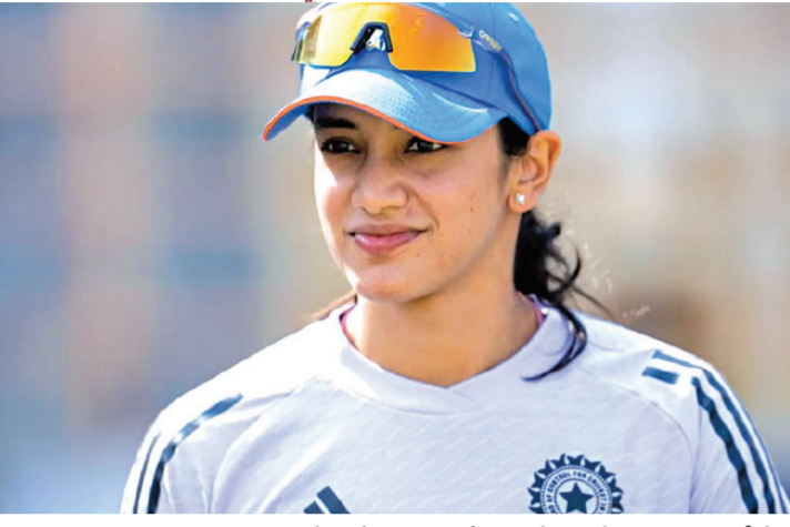
અડધી સદી ફટકારનારી ભારતીય બેટર છે. ભારતીય મહિલા ક્રિકેટ ટીમની વાર્ષિક ડેટન સ્મૃતિ મંધાના હંમેશા પોતાની રમત માટે સમાચારમાં રહે છે. ભારતની મંધાનાએ મહિલા T20 વર્લ્ડ કપ દરમિયાન ફરી એકવાર દેશ માટે સન્માન વધાર્યું છે. સ્મૃતિએ એવી યાદીમાં સ્થાન મેળવ્યું જેમાં વિરાટ કોહલી અને રોહિત શર્માનો પણ સમાવેશ નથી. પ્રતિષ્ઠિત ટાઇમ મેગેઝિનની 2026 માટે વિશ્વના સૌથી 100

સમાવેશ થાય છે. આ ટિગ્ગરોની યાદીમાં 29 વર્ષીય સ્મૃતિ મંધાનાનો પણ સમાવેશ થયો છે. મંધાનાના નામે ક્રિકેટ જગતમાં અનેક મહત્વપૂર્ણ રેકોર્ડ છે. તે ઘરેલુ ODI મેચમાં બેવડી સદી ફટકારનાર પ્રથમ ભારતીય મહિલા છે. મંધાના ત્રણેય આંતરરાષ્ટ્રીય ફોર્મેટમાં સદી ફટકારનાર પ્રથમ ભારતીય મહિલા પણ છે. સ્મૃતિના નામે કુલ 17 આંતરરાષ્ટ્રીય સદી છે, જે મહિલા ક્રિકેટમાં સંયુક્ત રીતે સૌથી વધુ છે. મંધાના એક કેલેન્ડર વર્ષમાં 1,000થી વધુ ODI રન બનાવનાર પ્રથમ મહિલા ક્રિકેટર પણ છે. મહિલા T20 વર્લ્ડ કપમાં શાનદાર શરૂઆત મંધાનાએ મહિલા T20 વર્લ્ડ કપમાં શાનદાર શરૂઆત કરી છે, જેમાં તેણે પાકિસ્તાન સામે 68 રન બનાવ્યા છે. મંધાનાએ મહિલા T20 વર્લ્ડ કપમાં માત્ર 26 ઈનિંગ્સમાં પાંચ અડધી સદી ફટકારી છે. મંધાના હરમનપ્રીત કોર અને મિતાલી રાજ સાથે સંયુક્ત રીતે સૌથી વધુ