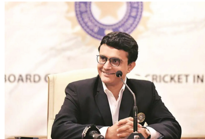
સૌરવ ગાંગુલીએ ફેસબુક પેજ વિરુદ્ધ FIR નોંધાવી