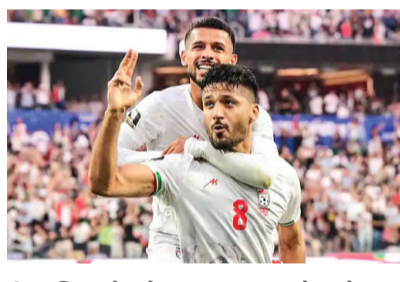
ઈરાની ફૂટબોલ ટીમે કહ્યું- અમને તરત જ અમેરિકા છોડવાનું કહ્યું