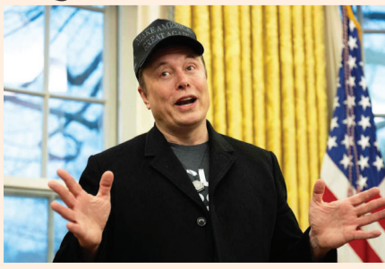
એલોન મસ્કને છપ્પરફાસ નફો, છેલ્લા 24 કલાકમાં વોરેન બફેટની કુલ સંપત્તિ કરતાં વધુ કમાણી

વૈશ્વિક અમીરોની યાદીમાં મસ્કનો દબદબો એલોન મસ્કને છપ્પરફાસ નફો, છેલ્લા 24 કલાકમાં વોરેન બફેટની કુલ સંપત્તિ કરતાં વધુ કમાણી મુંબઈ દુનિયાના સૌથી અમીર વ્યક્તિ એલોન મસ્કે કમાણીના તમામ રેકોર્ડ તોડી નાખ્યા છે. તેમની કંપની 'સ્પેસએક્સ' (SpaceX) શેરબજારમાં વિસ્તરતાં જ તેના શેરોમાં ભારે તેજી જોવા મળી છે. બ્લુમબર્ગ બિલિયોનર્સ ઇન્ડેક્સ અનુસાર, સ્પેસએક્સના સ્ટોકમાં આવેલા જબરદસ્ત ઉછાળાને કારણે એલોન મસ્કની કુલ સંપત્તિ (નેટવર્થ) વધીને 1.2 ટ્રિલિયન ડોલર પર પહોંચી ગઈ છે. નવાઈની વાત એ છે કે મસ્કે માત્ર એક જ દિવસમાં 164 અબજ ડોલર કમાયા છે, જે ડિગ્ગજ રોકાણકાર વોરેન બફેટની આખી જિંદગીની કુલ સંપત્તિ 148 અબજ ડોલર કરતાં પણ ઘણી વધારે છે. આ રેકોર્ડિંગ વધારા સાથે એલોન મસ્ક દુનિયાના અન્ય અમીરો કરતાં ઘણા આગળ નીકળી ગયા છે. મસ્ક અને બીજા નંબરના અમીર વચ્ચે હવે એટલો સર્ગઈ બ્રિન 292 બિલિયન ડોલર સાથે ત્રીજા નંબરે અને એમેઝોનના જેફ બેઝોસ 267 બિલિયન ડોલર સાથે ચોથા નંબરે છે. મોટો તફાવત છે જેને પાર કરવો મુશ્કેલ દેખાઈ રહ્યો છે. એલોન મસ્કની સંપત્તિ આટલી ઝડપથી વધવાનું