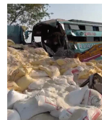
સ્તંભ થઈ ગયા હતા. પ્રાપ્ત વિગતો અનુસાર, હાઈવે પર

વડોદરા-હાલોલ હાઈવે પરથી એક અત્યંત હૃદયદ્રાવક અને કંપારી છૂટી જાય તેવા અકસ્માતના સમાચાર સામે આવ્યા છે. વડોદરાના કોટબી સ્ટેડિયમ પાસે વહેલી સવારે કાળમુખી લકઝરી બસ અને ટ્રક વચ્ચે સર્જાયેલા ગામખવાર અકસ્માતમાં 7 નિર્દોષ પ્રવાસીઓના કમકમાટીભર્યા મોત નીપજ્યા હતા. આ અકસ્માત એટલો ભયાનક હતો કે બસની કેબિનનો કચ્ચરણાળ વળી ગયો હતો, પરંતુ આ જ કેબિનમાં સ્થાપિત દેવાવિદેવ મહાદેવની મૂર્તિ કાચ તુટવા છતાં એકદમ સુરક્ષિત અને સલામત રહી હતી! જેને જોઈને ખુદ પોલીસ અને બચાવ કામગીરી કરનારા પણ