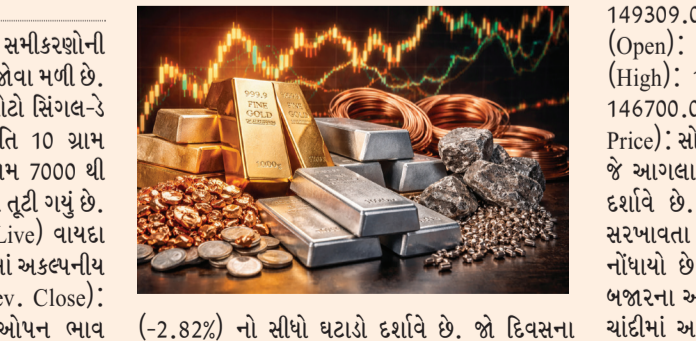
(-2.82%) નો સીધો ઘટાડો દર્શાવે છે. જો દિવસના સૌથી નીચા સ્તરની સરખામણી કરીએ તો તેમાં મહત્તમ 7048 નો મોટો કડાકો આવી ચૂક્યો છે. સોનાના ભાવની સ્થિતિ (MCX Gold Live) બીજા બાજુ સોનાના ભાવમાં પણ મોટું ગભરું પડ્યું છે. રોકાણકારો તેના કારણે મુંઝવણમાં મૂકાયા છે. જૂનો બંધ ભાવ (Prev. Close):

મુંબઈ વૈશ્વિક બજારમાં બદલાતા આર્થિક સમીકરણોની સીધી અસર ભારતીય કોમોડિટી માર્કેટ પર જોવા મળી છે. MCX પર સોના અને ચાંદીના ભાવમાં મોટો સિંગલ-ડે કડાકો નોંધાયો છે. સોનાના ભાવમાં પ્રતિ 10 ગ્રામ 2600 થી વધુ અને ચાંદીમાં પ્રતિ કિલોગ્રામ 7000 થી વધુનો આકરો ઘટાડો થતાં બજાર સંપૂર્ણપણે તૂટી ગયું છે. ચાંદીના ભાવની સ્થિતિ (MCX Silver Live) વાયાદ બજારની માહિતી અનુસાર, ચાંદીના ભાવમાં અકલ્પનીય ઘટાડો નોંધાયો છે: જૂનો બંધ ભાવ (Prev. Close): 237572.00 પ્રતિ કિલોગ્રામ નવો ઓપન ભાવ (Open): 232371.00 દિવસનો સર્વોચ્ચ ભાવ (High): 233166.00 દિવસનો સૌથી નીચો ભાવ (Low): 230524.00 સમાચાર લખાવા સુધીની સ્થિતિ (Live Price): ચાંદી અત્યારે 230879.00 પર ટ્રેડ કરી રહી છે, જે આગલા બંધ ભાવથી -6693.00