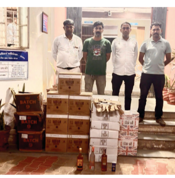
કાળા કલરની બુનાઈ વર્ના ગાડી (નંબર: GJ-02-BP-1001) માં ભારતીય બનાવટના વિદેશી દાડનો મોટો જથ્થો ભરીને બુટલેગરો મોટી રોબસ જે ડીસા તરફ જઈ રહ્યા છે. આ

બાતમીના આધારે પોલીસે તાત્કાલિક મોટી રોબસ ગામની સીમમાં વોચ ગોઠવી નાકાબંધી કરી દીધી હતી. યોડી જ વારમાં બાતમી વાળી કાળા કલરની વર્ના ગાડી આવતા પોલીસે તેને ઊભી રાખવા ઇશારો કર્યો હતો. પરંતુ, પોલીસને જોઈને બુટલેગરોના હોરા ઊડી ગયા હતા અને ચાલકે ગાડી ઊભી રાખવાના બદલે ત્યાંથી ભગાડી મૂકી હતી. એલ.સી.બી.ની ટીમે પણ ફિલ્મી સ્ટાઈલમાં આ શંકાસ્પદ ગાડીનો પીછો કર્યો હતો. પોલીસ પાછળ જ પડતાં ગભરાયેલા ચાલકે ગાડીને જાવલ ગામ તરફ ભગાવી હતી, જ્યાં કાબુ ગુમાવતાં ગાડી રસ્તાની સાઈડમાં એક મોટા પથ્થર સાથે ધડાકાભેર ટકરાઈ ગઈ હતી.