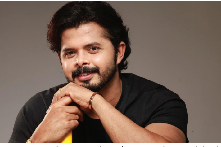
યાદવની શાનદાર કેપ્ટનશીપ ન હોત અને તિલક વર્માની મહત્વની ઈનિંગ્સ ન હોત, તો શું ભારત ચેમ્પિયન બની શક્યું હોત? ગંભીરને T20 વર્લ્ડ કપ જીતવાનો શ્રેય બિલકુલ ન આપવો જોઈએ.'

જેવા દિગ્ગજ ખેલાડીને મેન્ટર તરીકે લાવવો જોઈએ. ગંભીરને તાત્કાલિક અસરથી હટાવીને ધોનીને આ જવાબદારી સોંપવી જોઈએ, કારણ કે ગંભીર ખેલાડીઓ પર બિનજરૂરી દબાણ ઉભું કરે છે.' રાહુલ દ્રવિડનો કાર્યકાળ પૂરો થયા બાદ ગૌતમ ગંભીરને ટીમ ઈન્ડિયાના હેડ કોચ તરીકે નિયુક્ત કરવામાં આવ્યા હતા. ગંભીરની કોચિંગ હેઠળ ભારતીય ટીમે ઘણી સફળતાઓ હાંસલ કરી છે, જેમાં આ જ વર્ષે યોજાયેલો આઈસીસી T20 વર્લ્ડ કપ જીતવાનો પણ સમાવેશ થાય છે. જોકે, ટીમની આ ઐતિહાસિક સફળતા પર સવાલ ઉઠાવતા શ્રીસંતે કહ્યું કે, 'લોકો એવું કહી રહ્યા છે કે ગૌતમ ગંભીરે ટીમ ઈન્ડિયાને આ વર્ષે T20 વર્લ્ડ કપમાં ચેમ્પિયન બનાવી છે, પરંતુ એક સારા મેન્ટરની જરૂર છે. ગંભીરના અધીને ટીમ ઈન્ડિયામાં મહેન્ટ સિંહ ધોની