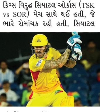
ઓર્કિસ પ્રથમ બેટિંગ કરતા માત્ર 2 વિકેટ ગુમાવીને 220 રનનો વિશાળ સ્કોર બડક્યો હતો. ટીમ માટે ટિમ સીફર્ટ શાનદાર બેટિંગનું પ્રદર્શન કરીને 104 રનની શતકીય ઈનિંગ્સ

મુંબઈ દક્ષિણ આફ્રિકાના પૂર્વ કેપ્ટન ફેફ ડુ પ્લેસિસ T20 ક્રિકેટમાં સદી ફટકારનાર વિશ્વનો સૌથી વધુ ઊંચાનો ખેલાડી બની ગયો છે. તેણે મેજર લીગ ક્રિકેટ 2026ની પ્રથમ જ મેચમાં ટેક્સાસ સુપર કિંગ્સ તરફથી રમતા સિયાટલ ઓર્કિસ સામે આ શાનદાર સિદ્ધિ મેળવી છે. હાલમાં ફેફ ડુ પ્લેસિસની ઉંમર 41 વર્ષ છે અને તેની આ વિસ્ફોટક ઈનિંગ્સના જોરે ટેક્સાસ સુપર કિંગ્સ એક અદ્ભુત અને યાદગાર જીત મેળવી છે. સિયાટલ ઓર્કિસ સામે આ શાનદાર સિદ્ધિ મેળવી છે. હાલમાં ફેફ ડુ પ્લેસિસની ઉંમર 41 વર્ષ છે અને તેની આ વિસ્ફોટક ઈનિંગ્સના જોરે ટેક્સાસ સુપર કિંગ્સ એક અદ્ભુત અને યાદગાર જીત મેળવી છે. સિયાટલ ઓર્કિસ સામે આ શાનદાર સિદ્ધિ મેળવી છે. હાલમાં ફેફ ડુ પ્લેસિસની ઉંમર 41 વર્ષ છે અને તેની આ વિસ્ફોટક ઈનિંગ્સના જોરે ટેક્સાસ સુપર