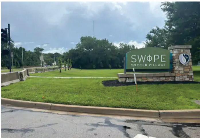
સ્વોપ સોકર વિલેજથી લગભગ 15 મિનિટના અંતરે છે. ઈંગ્લેન્ડની ટીમ કોચ થોમસ ટુબેલની આગેવાની હેઠળ અહીં જ અભ્યાસ કરી રહી છે.

લંડન ફૂટબોલ વર્લ્ડ કપમાં ઈંગ્લેન્ડ ટીમનાં બેઝથી 15 મિનિટનાં અંતરે ફાયરિંગથી એકનું મોત અને 4 લોકો ઘાયલ થયા છે. અમેરિકાના કેન્સસ સિટીમાં 22 વર્ષીય ઓસ્કર સંચોજ-મુનોઝને ઘટનાનો દોષી ઠેરવ્યો છે. જોકે, અડધા કલાકની અંદર ચાર ફાયરિંગ કર્યા બાદ આરોપી ફરાર છે. પોલીસનાં જણાવ્યા મુજબ, મંગળવારે રાત્રે ચાર અલગ-અલગ ગોળીબાર કર્યા હતા. આ ઘટનાઓમાં એક વ્યક્તિનું મોત થયું હતું, જ્યારે અન્ય ચાર ઘાયલ થયા હતા. આરોપી વિરુદ્ધ એક લાખ ડોલરનું વોરંટ પણ જારી કર્યું છે. આ પહેલા 6 જૂને પણ ઈંગ્લેન્ડનાં બેઝ કમ્પ્લી 6 માઈલ દૂર ફાયરિંગ થયું હતું. ગોળીબારની એક ઘટના પ્રોસ્પેક્ટ એવન્યુ વિસ્તારમાં બની હતી, જે ઈંગ્લેન્ડ ટીમના ટ્રેનિંગ બેઝ