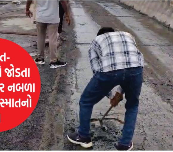
ગુજરાત-મધ્યપ્રદેશને જોડતા મુખ્ય માર્ગ પર નબળા કામથી અકસ્માતનો ભય

વાહનચાલકોનો સમય અને ઈંધણ બંનેનો વેડફાટ થઈ રહ્યો છે. નેશનલ હાઈવે ૫૬ એ માત્ર છોટાઉદેપુર જ નહીં, પરંતુ સમગ્ર ગુજરાત અને મધ્યપ્રદેશ વચ્ચેના આંતરરાજ્ય વ્યાપાર અને પરિવહન માટેની મુખ્ય જીવાદોરી છે. આ હાઈવે પરથી રોજબરોજ હજારો નાના-મોટા અને ભારે માલવાહક વાહનો પસાર થાય છે. આવા વ્યસ્ત અને મહત્વના માર્ગ પર આવેલો ચિસાડિયા રેલવે બ્રિજ જો નબળી ગુણવત્તા સાથે રીપેર કરવામાં આવે, તો ભવિષ્યમાં મોટી હોનારત સર્જાઈ શકે છે.