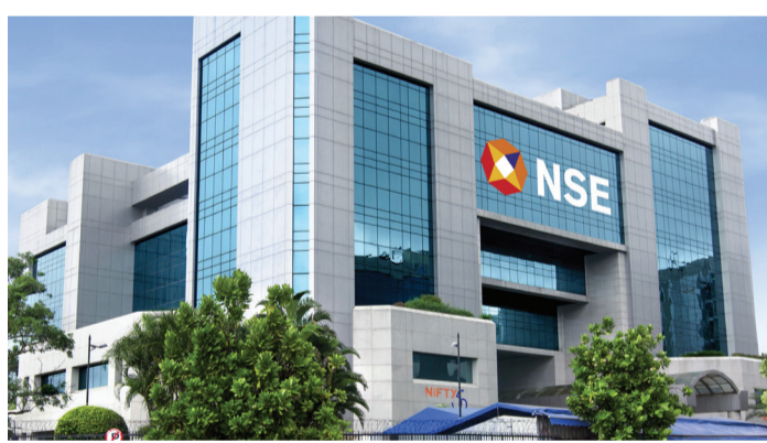
સહમિત કર્યા હતા, પરંતુ ચાલુ નિયમનકારી તપાસને કારણે પ્રક્રિયા અટકી ગઈ હતી. ટ્રેડિંગ વોલ્યુમની દ્રષ્ટિએ એનએસઈ ભારતનું સૌથી મોટું શેર બજાર છે અને વિશ્વનું સૌથી સક્રિય

મુંબઈ લાંબા સમયથી જેની રાહ જોવાઈ રહી હતી, એ નેશનલ સ્ટોક એક્સચેન્જ (એનએસઈ) આખરે તેના શેરોના ૩.૩૦,૦૦૦ કરોડના મેગા ઈનિશિયલ પબ્લિક ઓફરિંગ (આઈપીઓ) માટે ડ્રાફ્ટ પેપર સેબીમાં ફાઈલ કર્યા છે. જે આ વર્ષે ભારતના પ્રાઈમરી માર્કેટમાં સૌથી મોટું શેર વેચાણ બની રહેશે. આ સૂચિત આઈપીઓ ૧૪.૮૯ કરોડ જેટલો શેરોની સંપૂર્ણ ઓફર ફોર સેલ (ઓએફએસ) હશે. આઈપીઓ ફાઈલિંગ દેશના સૌથી મોટા સ્ટોક એક્સચેન્જ માટે એક મુખ્ય સીમાચિહ્નરૂપ છે, જે લગભગ એક દાયકાથી પબ્લિકમાં જવાનો પ્રયાસ કરી રહ્યું છે. એનએસઈએ સૌપ્રથમ ૨૦૧૬માં મૂડી બજાર નિયામક સેબીને ડ્રાફ્ટ આઈપીઓ ડોક્યુમેન્ટ