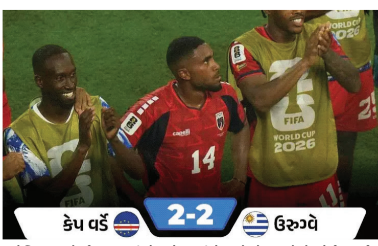
કેપ વર્ડ 2-2 ઉરુગ્વે બેલ્જિયમ અને ઈરાન 0-0થી ગ્રો રહ્યો. બંને ટીમો ટુર્નામેન્ટમાં તેની પ્રથમ જીતની શોધમાં હતી, પરંતુ મજબૂત રમવાના ઈલેવનમાં કારણે કોઈ ગોલ થઈ શક્યો નહીં. આ ગ્રો પછી બંને ટીમોના બે મેચમાં બે-બે પોઈન્ટ થઈ ગયા છે. બેલ્જિયમ માટે સ્ટાર સ્ટ્રાઈકર રોમેલુ લુકાકુ લગભગ એક વર્ષ પછી ફિફા વર્લ્ડ કપમાં પાછો ફર્યો. જ્યારે, ઈરાનનો એક ગોલ આફસાઈડને કારણે રદ કરવામાં આવ્યો. બેલ્જિયમને 66મી મિનિટે મોટો જીતકો લાગ્યો, જ્યારે સેન્ટર-બેક નાથન નગોયને 23 કાર્ડ મળ્યો અને ટીમને છેલ્લા 24 મિનિટ 10 ખેલાડીઓ સાથે રમવું પડ્યું. ઈરાન તેનો ફાયદો ઉઠાવી શક્યું નહીં અને મેચ ગોલરહિત ગ્રો પર સમાપ્ત થઈ. ગાર્સિયાએ ક્યું- ઘણી તકો મળી, પણ ગોલ કરી શક્યો નહીં મેચ પછી બેલ્જિયમના કોચ રૂડી ગાર્સિયાએ ક્યું કે તેની ટીમે રણનીતિ મુજબ સારો દેખાવ કર્યો, પરંતુ ફિનિશિંગમાં કમી રહી. ગાર્સિયાએ ક્યું, 'અમે ઈરાન સામે ત્રણ ગોલથી જીતી શક્યા હોત, પરંતુ અમે એટલા પ્રભાવી ન રહ્યા. અમે ઘણી તકો બનાવી. ફૂટબોલમાં જ્યારે તમે ગોલ ન કરો, ત્યારે મેચ જીતી શકતા નથી. રમત અને રણનીતિની દ્રષ્ટિએ અમે જેવું પ્રદર્શન કરવા માંગતા હતા તેવું જ ક્યું, પરંતુ ગોલ કરવામાં નિષ્ફળ રહ્યા.'

ફિફા વર્લ્ડ કપ 2026માં સોમવારે શુપ G અને શુપ Hની મેચો રમાઈ. શુપ G માં ઈજિપ્ટને ન્યૂઝીલેન્ડને 3-1 થી હરાવીને ટુર્નામેન્ટના ઇતિહાસમાં પોતાની પ્રથમ જીત નોંધાવી. ઈજિપ્ટને પોતાનો પ્રથમ વર્લ્ડ કપ 1934માં રમ્યો હતો. જ્યારે, બેલ્જિયમ અને ઈરાન વચ્ચેની મેચ 0-0 ની બરાબરી પર રહી. શુપ H ની મેચમાં કેપ વર્ડને શાનદાર રમત બતાવતા બે વખતની વિશ્વ ચેમ્પિયન ઉરુગ્વેને 2-2થી ગ્રો પર રોકી દીધું. આ પરિણામો પછી બંને શુપોમાં નોકઆઉટ રાઉન્ડમાં પહોંચવાની લડાઈ વધુ રોમાંચક બની ગઈ છે. કેપ વર્ડને પૂર્વે વર્લ્ડ ચેમ્પિયન ઉરુગ્વેને 2-2ની બરાબરી પર રોકીને મોટો અપસેટ સર્જ્યો. મિયામીમાં રમાયેલી મેચમાં કેપ વર્ડને પાછળ રહ્યા બાદ શાનદાર વાપસી કરીને એક પોઈન્ટ મેળવ્યો. આ પહેલા તેણે સ્પેનને પણ 0-0થી ગ્રો પર રોક્યું હતું. આ ગ્રો સાથે જ શુપ Hમાં નોકઆઉટની રેસ ખૂબ જ રોમાંચક બની ગઈ છે. સ્પેન 4 પોઈન્ટ સાથે શુપમાં ટોચ પર છે, જ્યારે ઉરુગ્વે અને કેપ વર્ડ બંનેના 2-2 પોઈન્ટ છે.