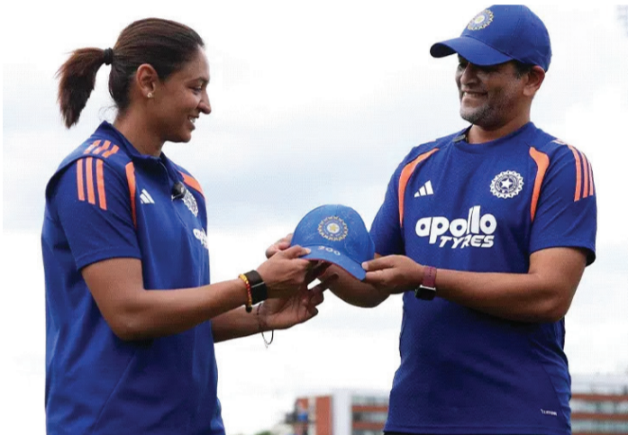
શ્રી ચરણીએ 5બલ વિકેટ મેડન ઓવર ફેંકી. સાઉથ આફ્રિકાનો વર્લ્ડકપમાં હાઈએસ્ટ રનચેઝ. સાઉથ આફ્રિકાને 159 રનનો ટાર્ગેટ હાંસલ કર્યો હતો. 4. શ્રી ચરણીએ પૂનમ યાદવના રેકોર્ડની બરાબરી કરી શ્રી ચરણીએ ભારત માટે વિમેન્સ ટી-20 વર્લ્ડ કપની એક સિઝનમાં સૌથી વધુ વિકેટ લેવાના પૂનમ યાદવના રેકોર્ડની બરાબરી કરી. ચરણીએ આફ્રિકા સામે 3 વિકેટ ઝડપી. તે આ ટુર્નામેન્ટમાં 10 વિકેટ મેળવી ચૂકી છે. પૂનમ વિમેન્સ ટી-20 વર્લ્ડ કપ 2020માં આટલી જ વિકેટ ઝડપી હતી. 5. ભારતે પાવરપ્લેમાં 59 રન બનાવ્યા ભારતે આ મેચમાં પાવરપ્લેમાં 2 વિકેટ ગુમાવીને 59 રન બનાવ્યા. આ વિમેન્સ ટી-20 વર્લ્ડ કપમાં ભારતનો બીજો સૌથી મોટો ટોટલ ચેઝ સાઉથ આફ્રિકાએ

સાઉથ આફ્રિકાએ વિમેન્સ T-20 વર્લ્ડ કપમાં ભારતને 6 વિકેટ હરાવ્યું. સાઉથ આફ્રિકાએ 159 રનનો ટાર્ગેટ હાંસલ કર્યો. આ T-20 વર્લ્ડ કપનો ત્રીજો અને સાઉથ આફ્રિકાનો સૌથી મોટો રનચેઝ રહ્યો. રવિવારે ભારતીય કેપ્ટન હરમનપ્રીત કૌર 200 T-20 રમનારી વિશ્વની પ્રથમ ક્રિકેટર બની. કેપ્ટન તરીકે આ તેમની 200મી આંતરરાષ્ટ્રીય મેચ પણ હતી. 1. હરમન 200 T-20 આંતરરાષ્ટ્રીય મેચ રમી હરમનપ્રીતે 200મી ટી-20 આંતરરાષ્ટ્રીય મેચ રમી. તે મેન્સ અને વિમેન્સમાં આવું કરનારી વિશ્વની પ્રથમ ક્રિકેટર બની. ન્યૂઝીલેન્ડની સુઝી બેટ્સ 184 મેચો સાથે બીજા નંબર પર છે. મેન્સમાં આયર્લેન્ડના પોલ સ્ટેલિંગ (163 મેચ) પ્રથમ અને રોહિત શર્મા (159 મેચ) બીજા સ્થાને છે. 2. હરમનના કેપ્ટન તરીકે 200 મેચ