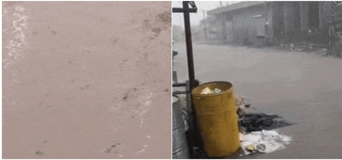
આલોદ, પંથક પંચિત

હજુ ગુજરાતમાં સત્તાવાર રીતે ચોમાસાનું આગમન નથી થયું, પરંતુ તે પહેલાં જ અમરેલી જિલ્લામાં મેઘરાજાએ ધડબડાટી બોલાવવાનું શરૂ કરી દીધું છે. હવામાન વિભાગ દ્વારા ચોમાસાની સત્તાવાર જાહેરાત થાય તે પહેલાં જ અમરેલીમાં સતત 5મા દિવસે વરસાદનું ધમાકેદાર આગમન થયું છે.