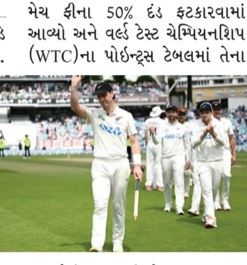
મેચ ફીના 50% ઇંડ ફટકારવામાં આવ્યો અને વર્લ્ડ ટેસ્ટ ચેમ્પિયનશિપ (WTC)ના પોઈન્ટ્સ ટેબલમાં તેના સમાપ્ત થઈ હતી. અંતિમ દિવસે ઇંગ્લેન્ડની ઈનિંગ્સ માત્ર એક કલાકની અંદર સમેટાઈ ગઈ. ઇંગ્લેન્ડની છેલ્લી આશા ઈન્ટરીમ કેપ્ટન જો રૂટ હતો, જે ચોથા દિવસે 75 રન બનાવીને અણનમ પરત કર્યો હતો. રમત શરૂ થયાના માત્ર આઠ મિનિટ પછી મેટ હેનરીના અંદર આવતા બોલ પર તે LBW આઉટ થયો. રૂટ પોતાના સ્કોરમાં માત્ર બે રન ઉમેરી શક્યો અને 77 રન બનાવીને પેવેલિયન પરત કર્યો. રૂટના આઉટ થતા જ ઇંગ્લેન્ડનો નીચલો કમ સંપૂર્ણપણે વિખેરાઈ ગયો. જોશ આર્ચર, મેટ કિશર અને જોશ ટંગ ખાતું ખોલ્યા વિના મેટ હેનરીનો શિકાર બન્યા.

બીજી ટેસ્ટ મેચમાં ન્યૂઝીલેન્ડે ઇંગ્લેન્ડને 253 રનથી હરાવ્યું. લંડનના ઓવલ મેદાન પર રમાયેલી સિરીઝની બીજી મેચના પાંચમા દિવસે 463 રનના ટાર્ગેટને ચેલ કરવા ઈનિંગ્સમાં માત્ર 209 રન જ બનાવી શકી. ન્યૂઝીલેન્ડના ફાસ્ટ બોલર મેટ હેનરીએ કારકિર્દીનું સર્વશ્રેષ્ઠ પ્રદર્શન કરતા કુલ 11 વિકેટ ઝડપી. આ જીત સાથે ન્યૂઝીલેન્ડે સિરીઝમાં 1-1ની બરાબરી કરી લીધી. હારની સાથે ઇંગ્લેન્ડ માટે ICC તરફથી પણ પરાબ સમાચાર આવ્યા. સ્વો ઓવર રેટને કારણે ઇંગ્લેન્ડ પર