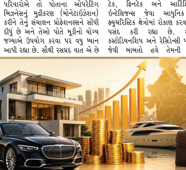
ટેક, ફિન્ટેક અને આર્ટિફિશિયલ ઇન્ટેલિજન્સ જેવા આધુનિક અને ફ્યુચરિસ્ટિક ક્ષેત્રોમાં રોકાણ કરવાનું વધુ પસંદ કરી રહ્યા છે. શાસન, જગ્યાએ ઉપયોગ કરવા પર વધુ ધ્યાન આપી રહ્યા છે. સૌથી રસપ્રદ વાત એ છે

ભારત અત્યારે આર્થિક વિકાસના એક સુવર્ણ યુગમાંથી પસાર થઈ રહ્યું છે, જ્યાં અબજોપતિઓની સંખ્યામાં અત્યંત વધારો જોવા મળી રહ્યો છે. 'ધ ઈકોનોમિક ટાઈમ્સ' અને '1લેટિસ' (1Lattice, વ્યવસાયિક સંશોધન અને સલાહકાર સંસ્થા) ના 'ધ ઈન્ડિયન કેમિલી ઓફિસ રિપોર્ટ 2026' અનુસાર, ભારતમાં $30 મિલિયન (આશરે રૂ. 280 કરોડ) થી વધુ સંપત્તિ ધરાવતા પરિવારોની સંખ્યામાં મોટો ઉછાળો આવવાનો છે. વર્ષ 2025 માં આવા પરિવારોની સંખ્યા 16,000 હતી, જે વર્ષ 2030 સુધીમાં વધીને લગભગ 26,000 થવાની ધારણા છે. અલ્ટ્રા-હાઈ-નેટ-વર્થ લોકોની યાદીમાં નવા સભ્યો ઉમેરવાની બાબતમાં ભારત અત્યારે વૈશ્વિક સ્તરે માત્ર અમેરિકા અને ચીનથી જ પાછળ એટલે કે વિશ્વમાં ત્રીજા ક્રમે છે. સમયની સાથે આ પરિવારોના રોકાણના અભિગમમાં પણ મોટો બદલાવ આવ્યો છે. અગાઉની પેઢીઓ જ્યાં પરંપરાગત રીતે સક્રિય રહીને પોતાના મુખ્ય વ્યવસાયો ચલાવતી હતી, તેનાથી વિપરીત આજની નવી પેઢી સંપત્તિના સક્રિય સંચાલન અને રોકાણ પર વધુ ધ્યાન કેન્દ્રિત કરી રહી છે. કેટલાક મોટા પરિવારોએ તો પોતાના આપોરેટિંગ બિઝનેસનું મુદ્દીકરણ (મોનેટાઈઝેશન) કરીને તેનું સંચાલન પ્રોફેશનલને સોંપી દીધું છે અને તેઓ પોતે મૂડીનો યોગ્ય કસ્ટોડિયનશિપ અને રેસિડેન્સી પ્લાનિંગ જેવી બાબતો હવે તેમની સંપત્તિ