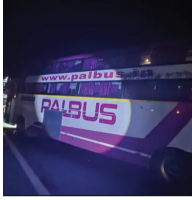
હિંમતનગર-અમદાવાદ નેશનલ હાઈવે 48 પર કાટવાડ નજીક રવિવારે મોડી રાત્રે એક ગમખવાર અકસ્માત સર્જાયો હતો.

હિંમતનગર-અમદાવાદ નેશનલ હાઈવે 48 પર કાટવાડ નજીક રવિવારે મોડી રાત્રે એક ગમખવાર અકસ્માત સર્જાયો હતો. સુરતથી જોધપુર જઈ રહેલી એક ખાનગી લક્ઝરી બસ કોઈ અજાણ્યા વાહન સાથે ધડાકાભેર અથડાતાં અકસ્માતનો ભોગ બની હતી. આ દુર્ઘટનામાં બસના ચાલક સહિત કુલ સાત મુસાફરો ગંભીર રીતે ઘાયલ થયા છે.