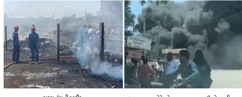
ભરૂચ, ટુંગી જાકીર

અંકલેશ્વરના બાકરોલ ઓવરસિજિંગ નજીક આવેલા એક સ્કેપ ગોડાઉનમાં આજે બપોરે ભીષણ આગ ફાટી નીકળી હતી. આ આગ કેમિકલ વેસ્ટના કારણે વિકરાળ બની હતી અને નજીકના શ્રમજીવિઓના ઝૂંપડા સુધી પણ ફેલાઈ હતી. ગોડાઉનમાં વાસ્તિક સહિત વિવિધ પ્રકારનો વેસ્ટ અને કેમિકલ વેસ્ટનો મોટો જથ્થો સંગ્રહ કરાયો હતો. કેમિકલ વેસ્ટને કારણે આગે ઝડપથી વિકરાળ સ્વરૂપ ધારણ કર્યું હતું. આગના કારણે