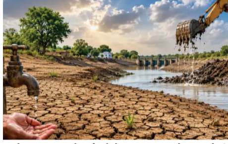
આજે પણ અધૂરાં છે. એટલે કે, કુલ મંજૂર થયેલા કામોની સરખામણીએ લગભગ અડધાઅડધ (46.64 ટકા) કામગીરી પૂર્ણ થઈ શકી નથી! ચોમાસું માથે આવીને ઊભું રહી ગયું છે અને વરસાદ શરૂ થઈ ચૂક્યો છે, ત્યારે આ અધૂરા કામોના કારણે જળસંગ્રહ કેવી રીતે થશે અને સરકારી કરોડો રૂપિયા પાણીમાં જશે કે શું? તેવા આકરા સવાલો જનતા પૂછી રહી છે.

ચોમાસાના વરસાદી પાણીનો સંગ્રહ કરવા, ભૂગર્ભ જળસ્તર ઊંચા લાવવા અને ખેડૂતોને સિંચાઈનો વેગ આપવાના ભણગાં ફૂંકતી રાજ્ય સરકારના 'સુજલામ સુફલામ જળ અભિયાન 2.0' ના ફસકાની વિગતો સામે આવી છે. ફેબ્રુઆરીથી મે-2026 દરમિયાન શરૂ કરાયેલા આ અભિયાનમાં તંત્રની આગસ જોઈને સરકારે મુદત લંબાવીને 15 જૂન કરી આપી હતી. પરંતુ, મુદત વધારાની ભેટ મળવા છતાં સરકારી બાબુઓ ફૂંકણની નિદ્રામાંથી જાગ્યા નથી. પરિણામે રાજ્યભરમાં હજારો કામો અધૂરાં લટકી રહ્યા છે અને હવે સરકારના પોતાના જ ઓંકડા આ આખા અભિયાનની પોલ ખોલીને સવાલોના કઠેરામાં ઊભા કરી રહ્યા છે.