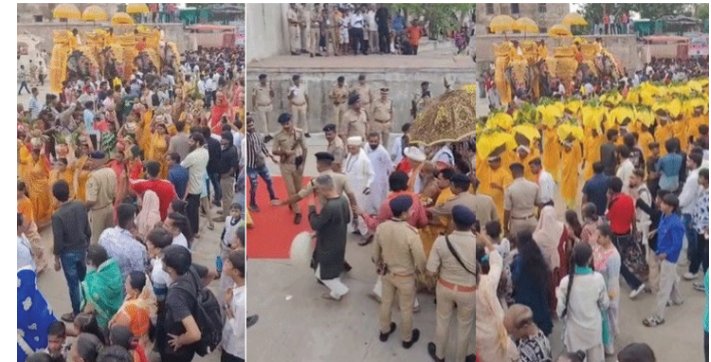
ભગવાન જગન્નાથજીની 149મી ઐતિહાસિક રથયાત્રા પહેલા સોમવાર, 29 જૂને પરંપરાગત જળયાત્રા યોજાઈ હતી અને 108 કળશમાં નદીના નીરથી ભગવાનનો જળાભિષેક કરાયો હતો