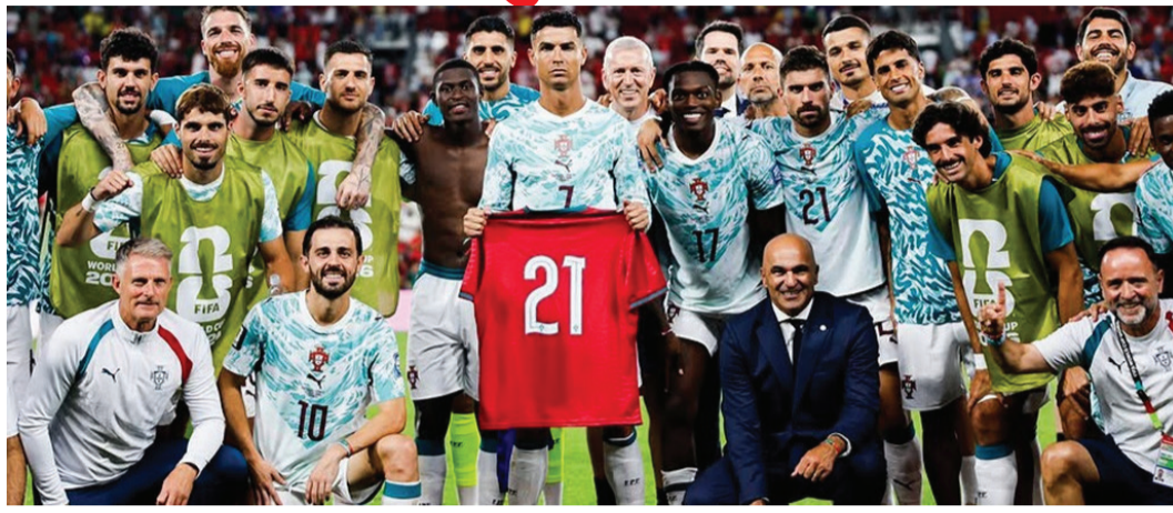
જીત અપાવી હતી. હવે સોમવારે સ્પેન સામે ટક્કર ક્રોએશિયાના જોસ્કો ગ્વાર્ડિઓલે છેલ્લી ઘડીએ ગોલ કરીને મેચ બરાબરી પર લાવવાનો પ્રયાસ કર્યો હતો, પરંતુ ફરી એકવાર VAR

મુંબઈ ફિફા વર્લ્ડ કપના રાઉન્ડ ઓફ 32ના એક અત્યંત રોમાંચક અને ભાવુક મુકાબલામાં પોર્ટુગલે ક્રોએશિયાને 2-1થી હરાવીને રાઉન્ડ ઓફ 16માં પોતાનું સ્થાન નિશ્ચિત કર્યું છે. જોકે, આ ઐતિહાસિક જીત બાદ ફૂટબોલ જગતના મહાન ખેલાડી ક્રિસ્ટિયાનો રોનાલ્ડો પોતાના આંસુ રોકી શક્યો નહોતો અને મેદાન પર જ રડી પડ્યો હતો. પોર્ટુગલની ટીમે આ મેચ પોતાના દિવંગત સાથી ખેલાડી ડિઓગો જોટાની પ્રથમ પુણ્યતિથિ પર તેને સમર્પિત કરી હતી. રોનાલ્ડો આ મેચમાં જોટાની યાદમાં તેની 21 નંબરની જર્સી પહેરીને રમ્યો હતો. વિવરપૂલના સ્ટાર ફોરવર્ડ ડિઓગો જોટા અને તેના ભાઈ આન્દ્રે સિલ્વાનું 3 જુલાઈ 2025ના રોજ સ્પેનમાં એક ભયાનક કાર દુર્ઘટનામાં મોત થયું હતું. આ દુર્ઘટના જોટાના