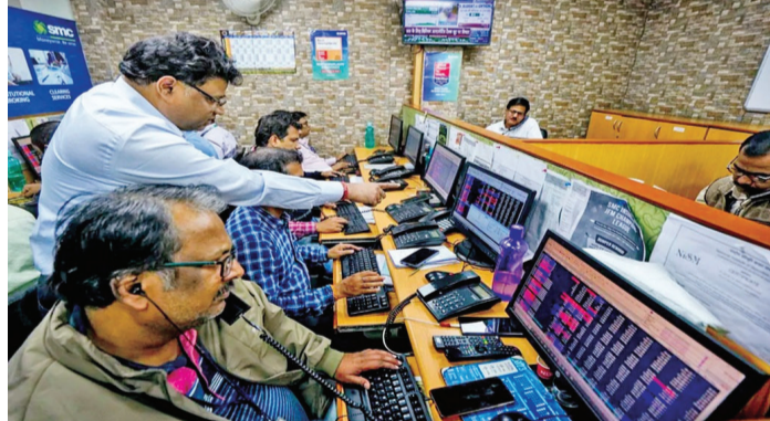
ઈક્વિટી કેશ સેગમેન્ટના વોલ્યુમ માટેનો અંદાજ સકારાત્મક રહે છે. કુલ ઓઈલના ભાવમાં નરમાઈ અને ચોમાસાની પ્રગતિ સાથે ચોક્કસકારોની ભાગીદારી વધી શકે છે. આ પરિબળો ઈક્વિટી કેશ બજારમાં નવા પરિબળો પૂરા પાડશે, અને આગામી અઠવાડિયામાં ટ્રેડિંગ વોલ્યુમ સ્થિર અથવા સુધરવાની અપેક્ષા છે. રેરિવેટિન્ગ ટ્રેડિંગ વોલ્યુમમાં એકંદર

મુંબઈ મે મહિનામાં ૨૨ મહિનાની ઊંચી સપાટીએ પહોંચ્યા પછી, જૂન મહિનામાં ઈક્વિટી કેશ સેગમેન્ટમાં ટ્રેડિંગ પ્રવૃત્તિ ધીમી પડી હતી કારણ કે ચોક્કસકારો નવી પ્રેરણાના અભાવે સાવચેત રહ્યા હતા. એનએસઈ અને બીએસઈ ના કેશ સેગમેન્ટમાં સરેરાશ દૈનિક ટર્ન ઓવર જૂનમાં માસિક ૭% થઈને રૂ. ૧.૪૧ લાખ કરોડ થયું હતું. આ ઘટાડો સતત ત્રણ મહિનાની વૃદ્ધિને બાદ જોવાયો છે. તેનાથી વિપરીત, ફ્યુચર્સ અને ઓપ્શન્સ (એફએન્ડઓ) સેગમેન્ટમાં સરેરાશ દૈનિક ટર્નઓવર ૩% વધીને રૂ. ૫૦૦.૬ લાખ કરોડ થયું હતું. આ મુખ્યત્વે મહિનાના છેલ્લા સપ્તાહિ સુધી દરમિયાન વધેલી પ્રવૃત્તિને કારણે હતું. આ ઉપરાંત, ટ્રેડિંગ પ્રવૃત્તિઓમાં પણ ઘટાડો થયેલો હતો.