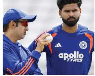
જ અનુકૂળ રહેશે. ભારત અને ઈંગ્લેન્ડ વચ્ચેની બીજી T20 મેચ શનિવારે, 4 જુલાઈએ માન્ચેસ્ટરના ઓલ્ડ ટ્રેફર્ડ મેદાન પર રમાશે. ભારતીય સમય પ્રમાણે આ મેચ સાંજે 7:00 વાગ્યે શરૂ થશે. મેચનો ટોસ અડધો કલાક પહેલાં એટલે કે સાંજે 6:30 વાગ્યે કરવામાં આવશે. પ્રથમ મેચમાં શું થયું હતું?

લંડન ભારતીય ક્રિકેટ ટીમના કેપ્ટન માટે એક સારા સમાચાર આવ્યા છે. ભારત અને ઈંગ્લેન્ડ વચ્ચે રમાયેલી બીજી T20 મેચ જોવા માટે હવે કેન્સે મોડી રાત સુધી ઉજાગરા કરવાની જરૂર નહીં પડે, કારણ કે આ મેચના સમયમાં ફેરફાર કરવામાં આવ્યો છે. ભારતીય ટીમ અત્યારે ઈંગ્લેન્ડના પ્રવાસે છે, જ્યાં બંને દેશો વચ્ચે 5 મેચોની T20 સિરીઝ રમાઈ રહી છે. આ સિરીઝની પ્રથમ મેચ ભારતીય સમય અનુસાર રાત્રે 10:00 વાગ્યે શરૂ થઈ હતી, પરંતુ વરસાદના કારણે તે પૂરી થઈ શકી નહોતી અને રદ કરવી પડી હતી. હવે બીજી મેચ માટે નવો સમય નક્કી કરવામાં આવ્યો છે જે કેન્સ માટે ખૂબ