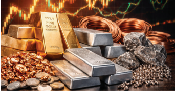
સોનું છેલ્લા ચાર દિવસમાં 4,686 રૂપિયા અને ચાંદી 13,374 રૂપિયા મોંઘી થઈ છે. આ પહેલા સોમવારે સોનું 1.41 લાખ રૂપિયા અને ચાંદી 2.2 લાખ રૂપિયા પર હતી. આ વર્ષે સોના-ચાંદીની કિંમતમાં સતત ઉતાર-ચઢાવ જોવા મળી રહ્યો છે.

ચાંદી ₹4,504 મોંઘી થઈને ₹2.33 લાખ પ્રતિ કિલો થઈ, સોનુ ચાર દિવસમાં કિંમત ₹4,686 હજાર વધી મુંબઈ સોના-ચાંદીના ભાવમાં આજે ૩ જુલાઈએ સતત ચોથા દિવસે તેજ જોવા મળી છે. ઈન્ડિયા બુલિયન એન્ડ નેવલર્સ એસોસિએશન (IBJA) અનુસાર, 10 ગ્રામ 24 કેરેટ સોનું 3,104 રૂપિયા વધીને 1,46,107 રૂપિયા પર પહોંચી ગયું છે. આ પહેલા ગુરુવારે તેની કિંમત 1,43,003 રૂપિયા પ્રતિ 10 ગ્રામ હતી. જ્યારે, એક કિલો ચાંદી 4,504 રૂપિયા વધીને 2,33,354 રૂપિયા પર પહોંચી ગઈ છે. આ પહેલા 2 જૂને તેની કિંમત 2,28,850 રૂપિયા પ્રતિ કિલો હતી. સોનું 2026માં અત્યાર સુધીમાં 12,908 રૂપિયા અને ચાંદી 2,934 રૂપિયા મોંઘી થઈ છે. 31 ડિસેમ્બર 2025ના રોજ 10 ગ્રામ સોનું 1.33 લાખ રૂપિયા પર હતું, જે હવે 1.46 લાખ રૂપિયા પર પહોંચી ગયું છે. જ્યારે, ચાંદી 31 ડિસેમ્બર 2025ના રોજ 2.30 લાખ રૂપિયા પ્રતિ કિલો હતી, જે હવે 2.33 લાખ રૂપિયા પર પહોંચી ગઈ છે. આ દરમિયાન 29 જાન્યુઆરીએ સોનાએ 1.76 લાખ રૂપિયા અને ચાંદીએ 3.86 લાખ રૂપિયાનો ઓલટાઈમ હાઈ પણ બનાવ્યો હતો.