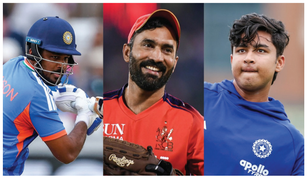
તેથી અનુભવી ખેલાડીને અત્યારે બેક કરવો જરૂરી છે.' કાર્તિકે વેભવના ભરપૂર વખાણ કર્યા વેભવના ટેલેન્ટના વખાણ કરતા કાર્તિકે ઉમેર્યું કે, 'વેભવ ખૂબ જ પ્રતિભાશાળી ખેલાડી છે અને ભવિષ્યમાં ઈન્ટરનેશનલ ક્રિકેટમાં સારું રમશે. પરંતુ માત્ર ટેલેન્ટના દમ પર ટીમમાં જગ્યા ન મળે, તેણે પોતાના પ્રદર્શનથી આ સ્થાન મેળવવું પડશે.' ભારતનો ટોસનો નિર્ણય યોગ્ય મેચમાં વાદળછાયું વાતાવરણ હોવા છતાં ભારતે પહેલા બેટિંગ પસંદ કરી હતી. કાર્તિકે આ નિર્ણયને યોગ્ય ગણાવ્યો હતો. તેના મતે, તાજેતરમાં આયર્લેન્ડ સામે મળેલી 0-2ની હારના કારણે ટીમે આ રણનીતિ અપનાવી હતી. હવે 4 જુલાઈએ રમાયેલી બીજી T20માં સેમસનને ફરી તક મળે છે કે વેભવને, તેના પર સોની નજર રહેશે.

લંડન ઈંગ્લેન્ડ સામેની પ્રથમ T20 મેચમાં સંજૂ સેમસન ફરી સસ્તમાં આઉટ થતાં તેની નબળી કોર્મ પર સવાલો ઊભા થયા છે. તે સતત ત્રણ ઈનિંગ્સમાં નિષ્ફળ રહ્યો હોવાથી, હવે ઓપનર સંજૂ સેમસન ફક્ત 1 રન અને ઈશાન કિશન 0 રન બનાવીને જલ્દી આઉટ થઈ ગયા હતા. જોકે તે પછી અભિષેક શર્મા અને કેપ્ટન શ્રેયસ અચર્યે ધમાકેદાર બેટિંગ કરીને ભારતીય ઈનિંગ્સને સંભાળી હતી. અભિષેક શર્માએ ઈંગ્લેન્ડના બોલરોની પોલાઈ કરતા માત્ર 24 બોલમાં 59 રન ફટકારી દીધા હતા. જ્યારે શ્રેયસ અચર્યે 47 બોલમાં 68 રનનું યોગદાન આપ્યું હતું. અંતમાં શિવમ દુબેએ પણ આક્રમક બેટિંગ કરીને 21 બોલમાં અણનમ 42 રન બનાવ્યા હતા.