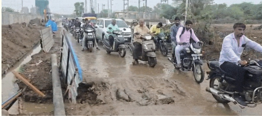
વરસાદી પાણી ઓસરતાં જ રસ્તાઓની બિસ્માર હાલત સામે આવી, વિજય ચાર રસ્તાથી હેલમેટ સર્કલ તરફ જતા મુખ્ય માર્ગ પર ડ્રેનેજ લાઈનના મેનહોલ પાસે રસ્તો બેસી ગયો છે

અમદાવાદમાં મધ્યરાત્રિએ 2 કલાકમાં 4 ઈંચ સુધીના વરસાદે AMCના પ્રી-મોન્સુન કામગીરીની પોલ ખોલી. ઓગણજમનાં સૌથી વધુ 4 ઈંચ વરસાદ નોંધાયો. ભારે વરસાદને કારણે હેલમેટ સર્કલ પાસે રસ્તો બેસી ગયો, જ્યારે અખબારનગર, મકરબા, મીઠાબળી અંડરપાસ બંધ કરાયા. ચાંદબેડામાં શોર્ટ સર્કિટથી એક વ્યક્તિને કરંટ લાગ્યો, અને દૂધેશ્વર સહિતના વિસ્તારોમાં દિવાલો ધરાશાયી થઈ. પહેલા જ વરસાદે શહેરની હાલત કંફોડી બનાવી.