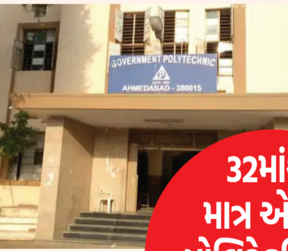
અભ્યાસ અને રોજગાર શ્રેણે આગળ વધી રહ્યા છે. અનેક વિદ્યાર્થીઓ દેશની પ્રતિષ્ઠિત સંસ્થાઓ તેમજ DRDO, ISRO સહિતની વિવિધ સંસ્થાઓમાં મહત્વની સેવાઓ આપી રહ્યા છે. છતાં ટેકનિકલ શિક્ષણનો પાયો મજબૂત બનાવતા

રાજ્યની સરકારી પોલિટેકનિક સંસ્થાઓમાં વર્ષોથી પડતર રહેલા પ્રશ્નોનો અંત લાવવા માટેની માંગ ઉઠી છે. પોલિટેકનિક અધ્યાપક મંડળ દ્વારા ટેકનિકલ શિક્ષણ ક્ષેત્રને પત્ર લખી ખાલી પડેલી જગ્યાઓ પર ભરતી કરવા માટે રજૂઆત કરી છે. તેમજ અટવાયેલી બઢતી પ્રક્રિયા પૂર્ણ કરવા અને તમામ સરકારી પોલિટેકનિકમાં નિયમિત આચાર્યની નિમણૂક કરવા પણ માંગ કરવામાં આવી છે. અનેક વખત રજૂઆત કરવા છતાં સરકાર દ્વારા હજુ સુધી અમુક પ્રશ્નોનો નિરાકરણ લાવવામાં આવ્યું નથી. જેથી વહેલી તકે માંગણીઓ નહીં સ્વીકારવામાં આવે તો આંદોલન કરવાની પણ ચીમકી ઉચ્ચારવામાં આવી છે. રાજ્યની સરકારી પોલિટેકનિક સંસ્થાઓમાં વર્ષોથી પડતર રહેલા પ્રશ્નોના ઉકેલ લાવવા માટે પોલિટેકનિક અધ્યાપક મંડળ દ્વારા કરી એક વખત રાજ્ય સરકાર સમક્ષ રજૂઆત કરવામાં આવી છે. પોલિટેકનિક અધ્યાપક મંડળ દ્વારા શિક્ષણ મંત્રીને પત્ર લખવામાં આવ્યો છે. રાજ્યની સરકારી પોલિટેકનિક સંસ્થાઓમાંથી દર વર્ષે હજારો વિદ્યાર્થીઓ ડિપ્લોમા પૂર્ણ કરીને ઉચ્ચ છતાં ટેકનિકલ શિક્ષણનો પાયો મજબૂત બનાવતા